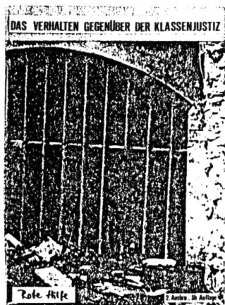
zweite, ergänzte Auflage Fr. 3.-

Solltest du Anlass zu der Vermutung haben, eines Tages mit der Schmier in unliebsamen Kontakt zu geraten, so ist es von Vorteil, jetzt noch diese Broschüre zu lesen. Sie gibt Auskunft über die Verhörmethoden der Polizei und sonstige Tricks dieser kriminellen Vereinigung. Und wie man sich dagegen wehrt. Zu beziehen bei Pinkus, Armadillo, Paranoia City usw. oder über Rote Hilfe Zürich Postfach 2027 8030 Zürich