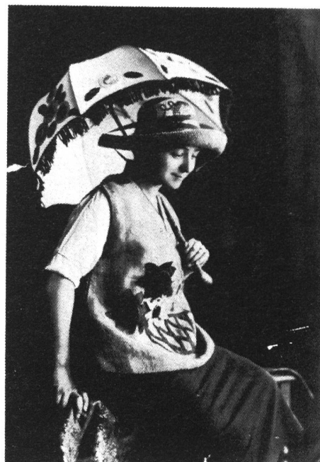
abb: portrait von sonja delaunay in einem selbst-entworfenen kleid.