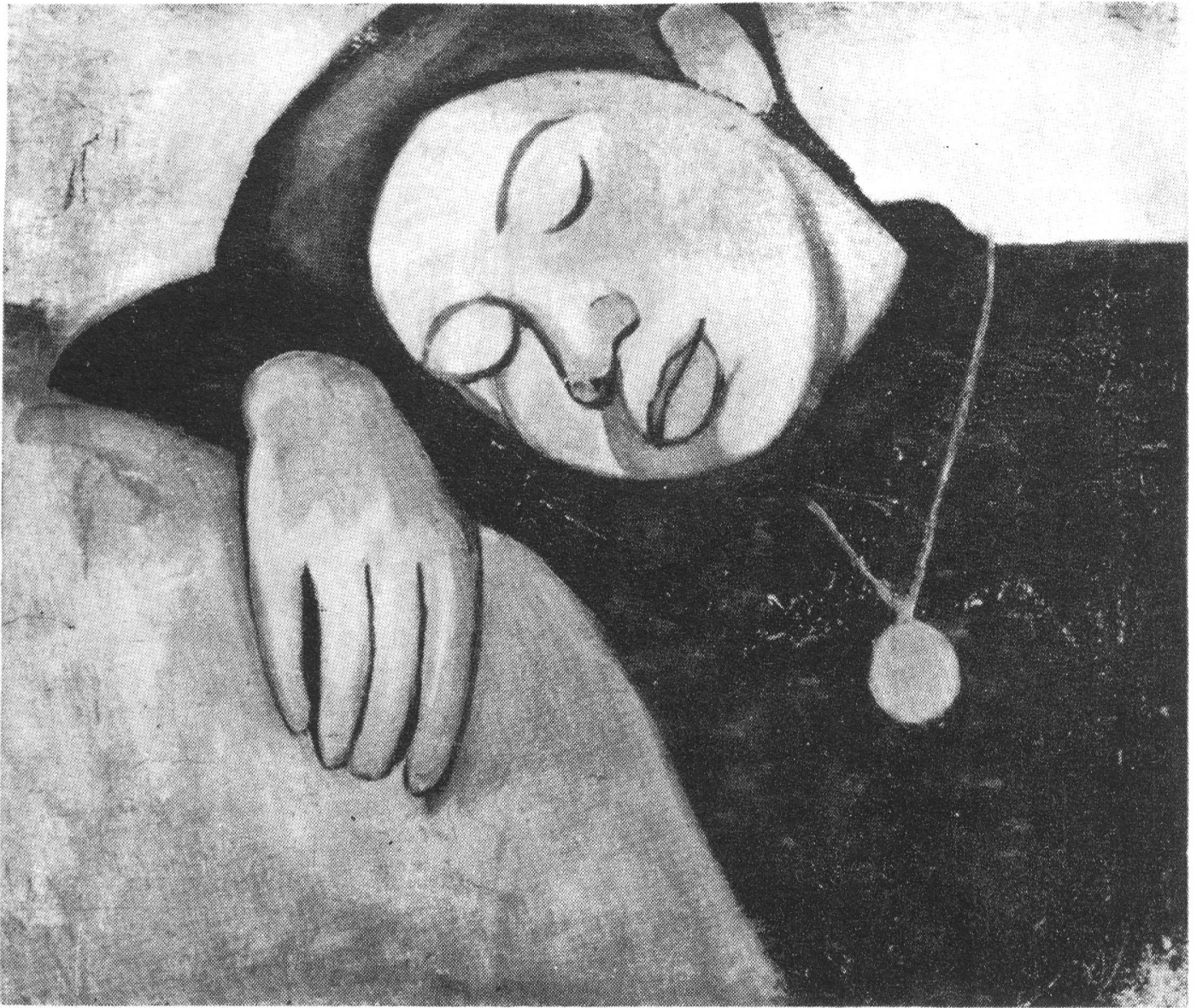
abb: sonia delaunay, 1907 "jeune fille endormie"