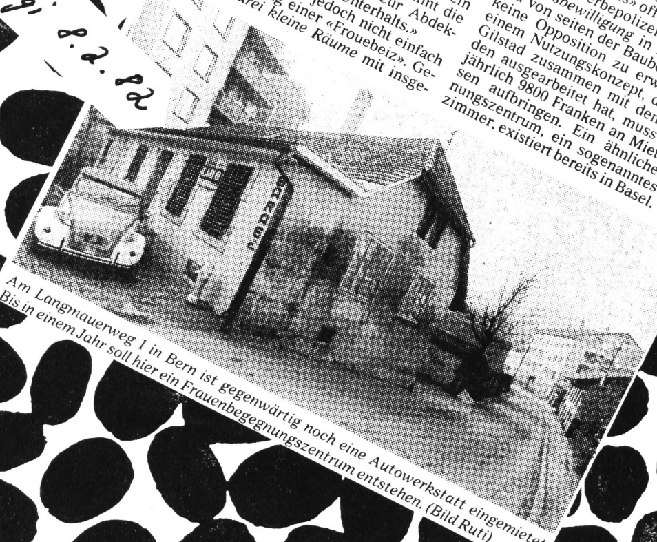
Am Langmauerweg 1 in Bern ist gegenwärtig noch eine Autowerkstatt eingemietet. Bis in einem Jahr soll hier ein Frauenbegegnungszentrum entstehen.