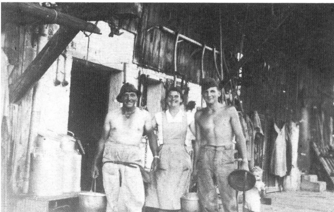
Auf dem Bauernhof, 1952

Im Mai 1939 kehrte ich nach Hause zurück. Alles redete vom Krieg. Im September war die Mobilmachung und alle Brüder mussten einrücken. Dann kaufte ich mir ein Velo. Vater fragte sofort, woher ich das Geld habe. «Vom Ersparten», sagte ich. Da wurde er böse und sagte, er schäme sich, dass seine Tochter von der Bank Geld hole. Er war eben im Vorstand von der Raiffeisen-