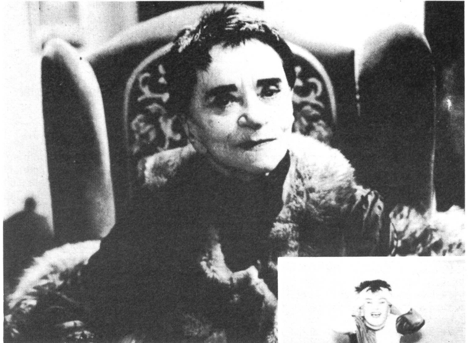
In Volker Schlöndorffs «Fangschuss» (1976)

Um 1930 wird sie ihrer jüdischen Abstammung wegen angegriffen und kriegt keine Auftrittsmöglichkeiten mehr. Zudem gilt sie als Linke und in ihrem künstlerischen Schaffen als 'entartet'. Während des Krieges kämpft sie sich in New York durch und kehrt nach dessen Ende nach Berlin zurück. Schmerzvoll muss sie erleben, nicht mehr verstanden zu werden. Valeska scheut sich nicht, in ihren Kabarettis Tabus der Nachkriegszeit, wie z.B. KZs aufzugreifen. Die meiste Zeit ihres restlichen Lebens verbringt sie in Kampen auf Sylt.