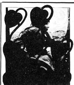
Elizabeth Bowen Efeu kroch übers Gestein

»In einer Erzählung ist alles erlaubt, was es an menschlichen Tollheiten gibt.« Elizabeth Bowen