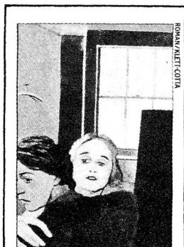
EMMANUÈLE BERNHEIM DAS KLAPPMESSER

Nie hat eine Frau bisher ähnlich kompromißlos, unerbittlich und zugleich witzig und phantasievoll über die Liebe auf des Messers Schneide geschrieben wie Emmanuèle Bernheim.