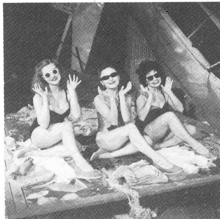
Drei von zwölf Tigerinnen wurden gewählt!

Unsere Arbeit bewegt sich zwischen FraP-Fraktion, FraP allgemein, Fraktions-, Kommissions- und Quartierarbeit. Ein Hau-