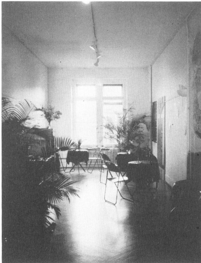
Wohngang in der Frauenétage

Frauenräume sind schon immer ein politisch brisantes Thema gewesen. Seit einiger Zeit hat der Druck vor allem von bürgerlicher Seite her wieder zugenommen. Nach der erzwungenen Schliessung des Frauenzentrums Winterthur ist jetzt auch die Frauenétage im Quartierzentrum Kanzlei bedroht. Nachfolgend ein Bericht zur aktuellen Situation und ein Solidaritätsaufruf an alle interessierten Frauen und Frauenprojekte.