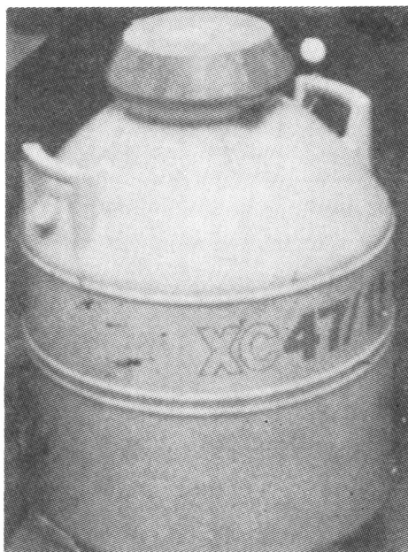
Ein Tank voll gefrorenes Sperma im Fenway Center in Boston