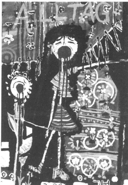
Es wird behauptet, dass sich Mütter einen sexuellen Missbrauch an ihren Kindern ausdenken.

Der skizzierte Fall ist leider kein Einzelfall. Mir begegnen in meiner Beratungspraxis immer wieder Berichte über die Exploration von Kindern an Tatorten. Manche GutachterInnen glauben, in einem einmaligen zweistündigen Kontakt von dem Opfer alles erfahren zu können und/oder haben zum Beispiel nur unzureichende Kenntnisse über die Methoden der Pornographieproduktion, wissen unter ande-