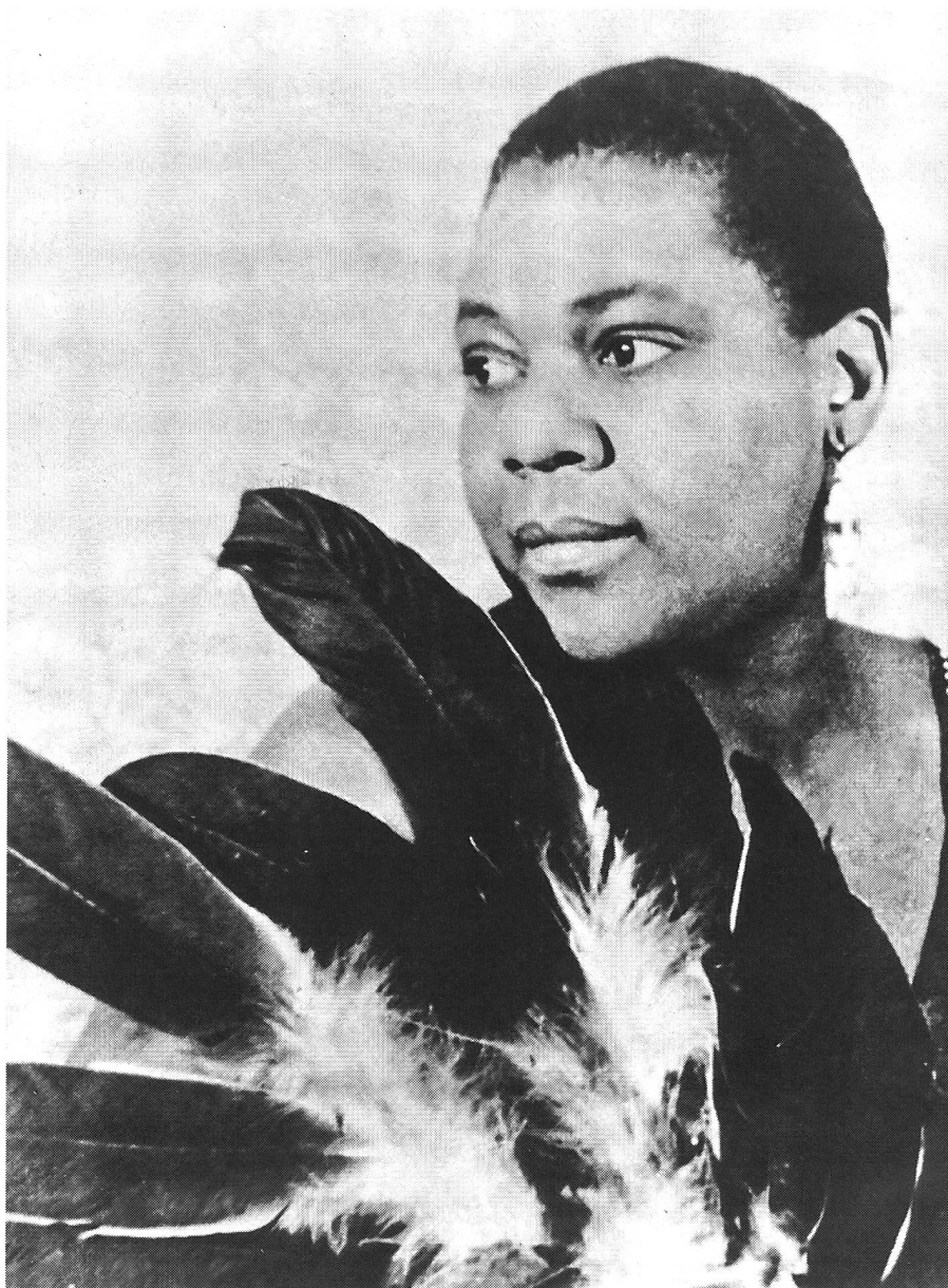
Eine der Big Mamas des Blues: Bessie Smith

Die SklavenhalterInnen untersagten ihnen oft, Musik zu machen. Gesetze verboten ihnen, Trommeln zu besitzen oder anzufertigen. Einerseits weil die Sklavenherren erkannten, dass sich SklavInnen mit Trommeln verständigen konnten, andererseits weil Trommeln Kult-Instrumente waren, mit denen sie ihre kulturellen und religiösen Bräuche pflegten.