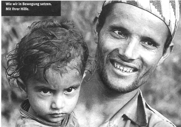
1997 werden in der Spendenwerbung die gängigen Rollenklischees durchbrochen

Wie wir in Bewegung setzen. Mit Ihrer Hilfe.