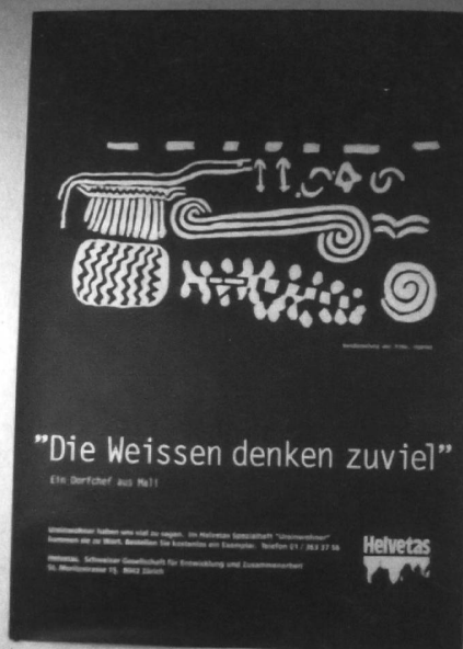
Die äusserst erfolgreiche UreinwohnerInnen-Kampagne (Helvetas, 1993)