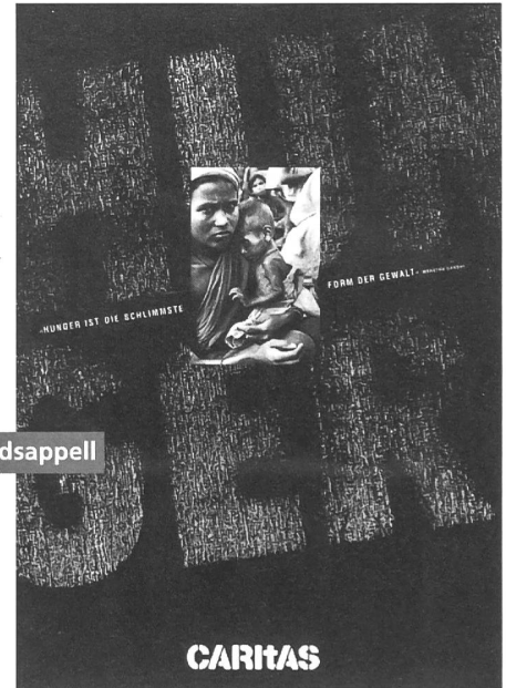
Spendenwerbung 1983: Mitleidsappell