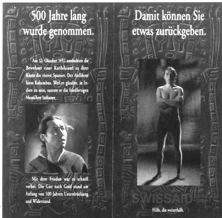
Kampagne von 1992, 500 Jahre nach der «Entdeckung» Amerikas durch Kolumbus