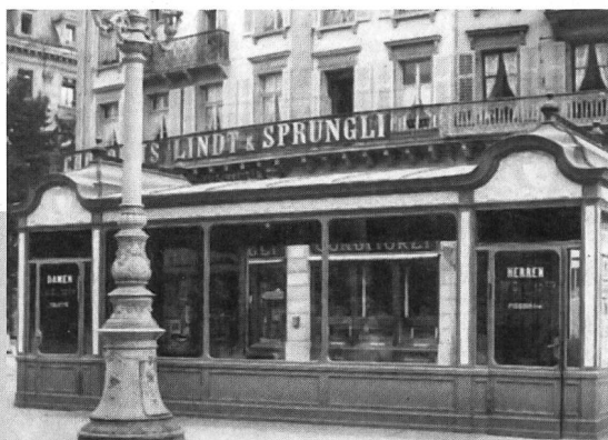
Das öffentliche Frauen-WC am Paradeplatz, 1899 als erste unterirdische Anlage erbaut.

Gerade Frauen aus der Unterschicht, Fabrikarbeiterinnen, Wäscherinnen oder Marktfrauen, müssen jedoch häufig lange Distanzen zu Fuss in der Stadt zurücklegen. Eine Eingabe des «Arbeiterinnenvereins» vom 29. Mai 1905 macht dies deutlich. Darin fordern die Frauen den Stadtrat auf, unentgeltliche WCs zur Verfügung zu stellen, wenigstens eine Schüssel pro Anlage. Sie begründen ihre Eingabe damit, dass «eine grosse Zahl erwerbstätiger Frauen einen weiten Weg zur Arbeitsstelle zurückzulegen hat, wobei sich der Mangel derartiger Anstalten oft spürbar