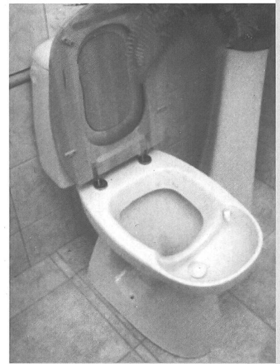
Abbildung 3: Was ist daran so anders? No-Mix-WC im Handel

No-Mix kann ein Beispiel für eine sinnvolle Verhaltensänderung sein; genau das hoffen wir, mit einem solchen WC erreichen zu können. Zusätzlich kann es sehr wassersparend sein, weil für das Wegspülen von Urin höchstens 1–2 dl Wasser notwendig sind. Bereits hier taucht aber die nächste Frage auf: Was mache ich mit dem WC-Papier, das vor allem