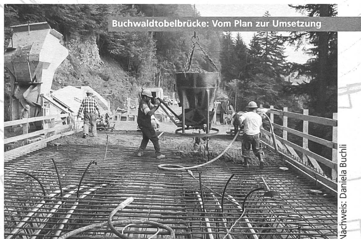
Buchwaldtobelbrücke: Vom Plan zur Umsetzung