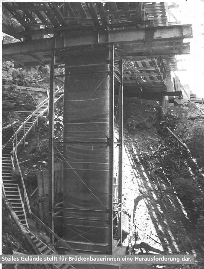
Steiles Gelände stellt für Brückenbauerinnen eine Herausforderung dar.

Daniela Buchli (37) zeichnet Brücken fürs Tiefbauamt Graubünden. Tiefe Schluchten zu überwinden, fasziniert sie.