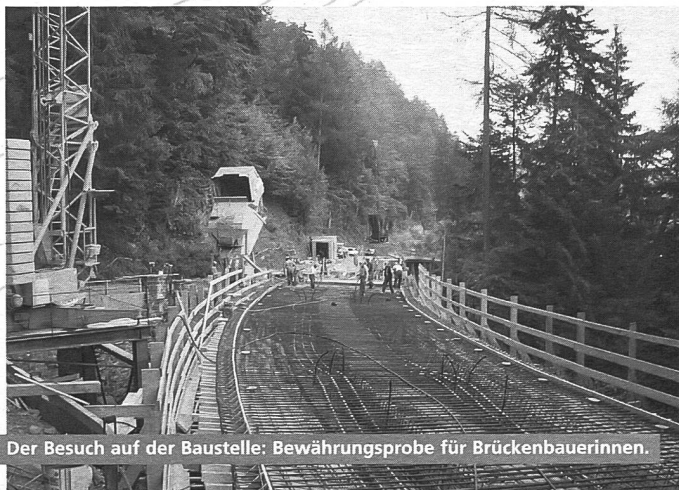
Der Besuch auf der Baustelle: Bewährungsprobe für Brückenbauerinnen.