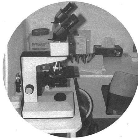
Das Doppelmikroskop im Labor. Klientinnen können mit der Ärztin «mitschauen».

gesundheit selber an die Hand zu nehmen und einen Schritt über das Weitergeben von Adressen und Informationen hinaus zu gehen. Was im Oktober 1981 mit der Eröffnung einer Beratungsstelle ohne Praxisbewilligung begann, entwickelte sich zu einer Werkstatt feministischer Medizin. Einer Praxis, in der die gängigen medizinischen Standards neu besetzt und in einen frauenfreundlichen Kontext gebettet werden sollten. Das hiess vor allem, die Klientinnen an der medizinischen Entscheidungsfindung teilhaben zu lassen, die Hierarchie zwischen Ärztin und Klientin abzuschwächen, alternative Heilverfahren anzubieten. Von 1982 bis Mitte 2001 war das Frauenambulatorium ein genossenschaftliches Frauenprojekt. Die Mitarbeitenden Fach- und Laienfrauen waren Genossenschafterinnen, also Arbeitgeberinnen und -nehmerinnen gleichzeitig, und verdienten alle gleich viel.