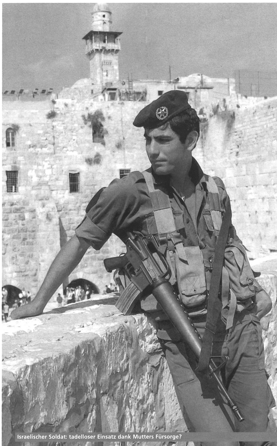
Israelischer Soldat: tadelloser Einsatz dank Mutters Fürsorge?

Was Mutterschaft in Israel mit Krieg zu tun hat