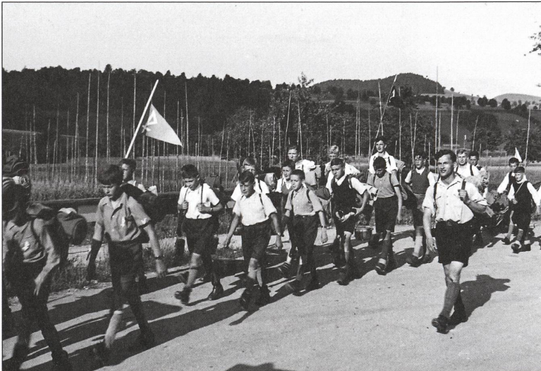
Die Schar Frick, einen Monat nach der Gründung, am Pfingsttreffen in Wallbach, 1943.

S: Hier achteten wir auf grosse Selbstständigkeit. Jede Gruppe verfügte über zwei Kochchessi. Beidseits eines Feuers rammte man zwei Astgabeln in den Boden, und darüber kam eine Querstange, an der die Chessi über dem Holzfeuer hingen. Meist kochten wir Gemüsesuppe mit Speck. Den gaben die Bauern gern ihren Buben mit. Er verlieh der Suppe jeweils ein köstliches Aroma. An einem kantonalen Jungwachttreffen erreichten wir im Wettkochen die beiden ersten Ränge. Neben der Kunst der Köche verdankten wir den Erfolg wohl dem schmackhaften Speck. Spaghetti waren übrigens eben-