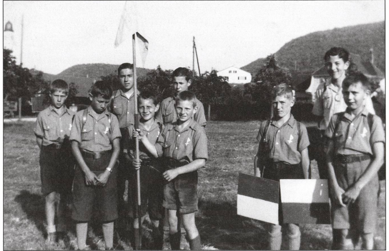
Unsere Morsemannschaft, 1945.

S: Geländespiele fanden bei schönem Wetter statt und waren oft sehr kampfbetont. Grosser Beliebtheit erfreute sich zum Beispiel das «Schatzspiel». Eine Gruppe, mit Armbändeln ausgestattet, musste einen Schatz durch den Wald transportieren. Auf dem Weg zum vorgegebenen Ziel wurde sie von einer zweiten Gruppe, den Räubern, überfallen. Das bot Anlass zu wilden Raufereien. Konnte man sich eines Armbändels bemächtigen, war dies gleichbedeutend mit dem «Tod» des Besiegten.