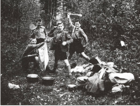
Jungwacht-Leben im Wald.

mit Besammlungsort löste eine Begeisterung aus, die man sich heute kaum mehr vorstellen kann. Das hängt damit zusammen, dass Kinder in der damaligen Gesellschaft keine grosse Beachtung fanden; man hielt sie nicht für so wichtig. Und wenn dann ein Bub einmal spürte, dass er von einer Person ernst genommen wurde, dass er Anerkennung und Förderung fand, dann tat sich ihm eine Welt nie erahnten Glücksgefühls auf. Das sprach sich auch herum. Darum bewarben sich schon Siebenjährige um den Eintritt in unsere Vereinigung. Hinzu kommt noch der Umstand, dass die damalige Jugend wenig Unterhaltungsmöglichkeiten hatte. Jugendvereine gab es damals nicht; der eine oder andere lernte vielleicht Handorgel spielen. Das war's. Im Grunde genommen hatten wir Jungwächter keine Konkurrenz.