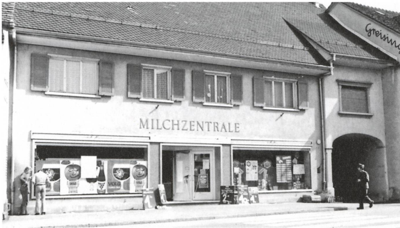
Der Neubau der Milchzentrale, bezogen im Jahr 1961.

mögliche Standorte im Dorfzentrum wurden näher geprüft und wieder verworfen, bis die Generalversammlung vom 25. April 1959 auf Antrag des Vorstandes schlussendlich dem Kauf der beiden Liegenschaften Wirtschaft und Metzgerei Rössli für Fr. 260'000.– und Bauernhaus Felix Mösch am Bogen für Fr. 60'000.– mit grossem Mehr zustimmte.