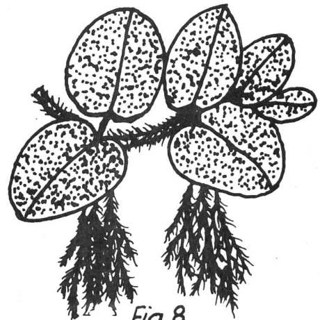
Fig. 8 Salvinia molesta (nach Cook)