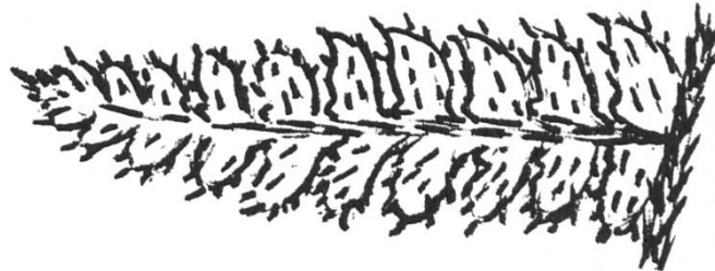
Polystichum braunii (Spenner) Fée

Nach J. Braun-Blanquet kommt Polystichum braunii im Kanton Graubünden nur im Misox vor. T. Reichstein hat nach seiner mündlichen Aussage den Farn auch im Bergell festgestellt. Die kleine Kolonie dieses Farns im Val Morteratsch auf rund 2000 m Höhe darf als ein bemerkenswertes Vorkommen bezeichnet werden.