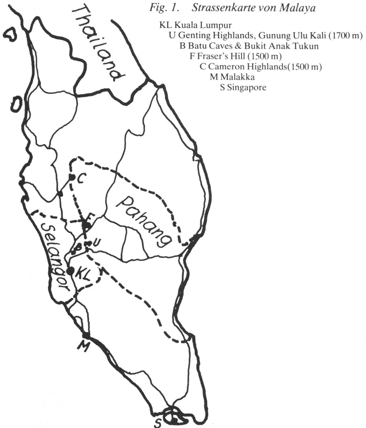
Fig. 1. Strassenkarte von Malaya

Ulu Kali. Die Gattung Matonia wurde fossil an vielen Stellen der Erde gefunden. Heute lebt einzig noch M. pectinata , ein „lebendes Fossil“, auf einigen Bergspitzen Malayas.