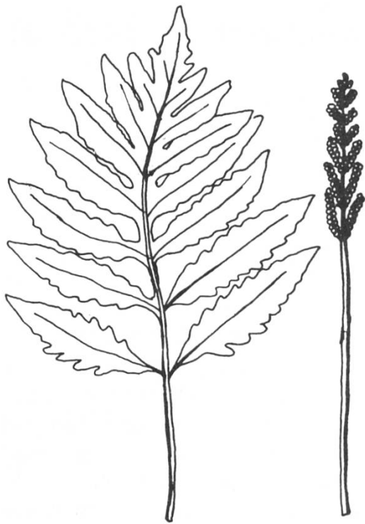
Fig. 1. Onoclea sensibilis

um die grösste bekannte Farnpflanze handeln. Das Alter dieses vielfachten Individuums muss beträchtlich sein.