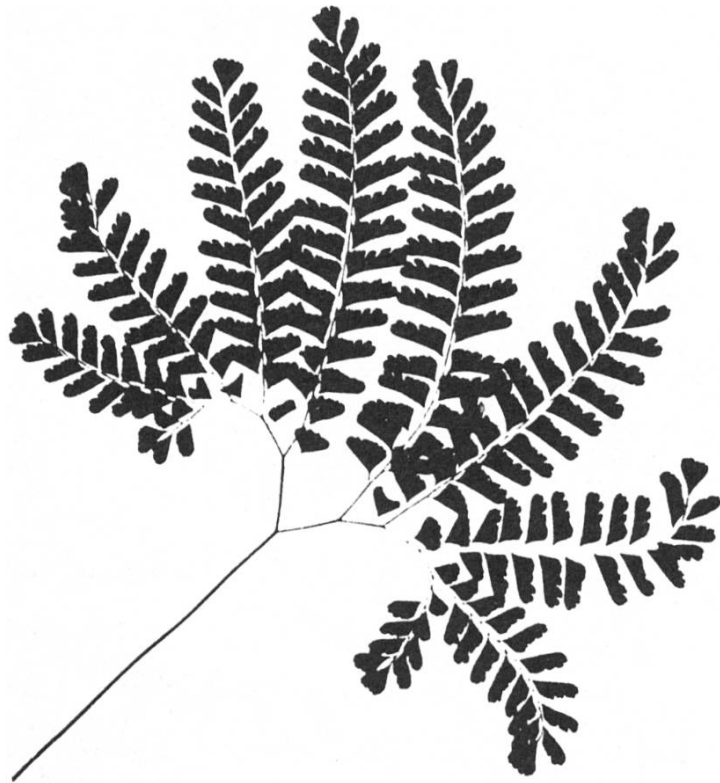
Fig. 4. Adiantum pedatum

und viele der westlichen Farne habe ich nicht in natura gesehen. Ein häufiger Farn, quasi das Pendant zum östlichen Polystichum acrostichoides , ist im Westen P. munitum , der sich unter anderem auch in den eindrucksvollen Mammutbaumwäldern (Redwood, Sequoia sempervirens ) findet und dort zusammen mit Athyrium filix-femina und Blechnum spicant vorkommt. Der Rippenfarn übrigens zeigt eine weitere pflanzengeographische Besonderheit, die er mit anderen Arten teilt, er kommt nur an der Westküste vor und findet sich ja dann wieder, wie wir wissen, in Europa.