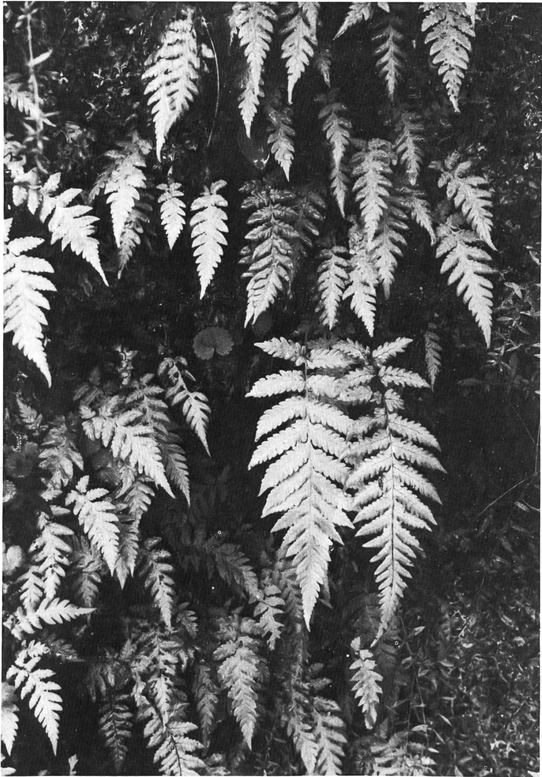
Abb. 2: Steter Levadabegleiter ist Thelypteris pozoi zusammen mit Sibthorpia peregrina (nierenförmiges; gekerbtes Blatt über der Bildmitte) und dem mexikanischen Eindringling Erigeron karwinskianus (am rechten unteren Bildrand).