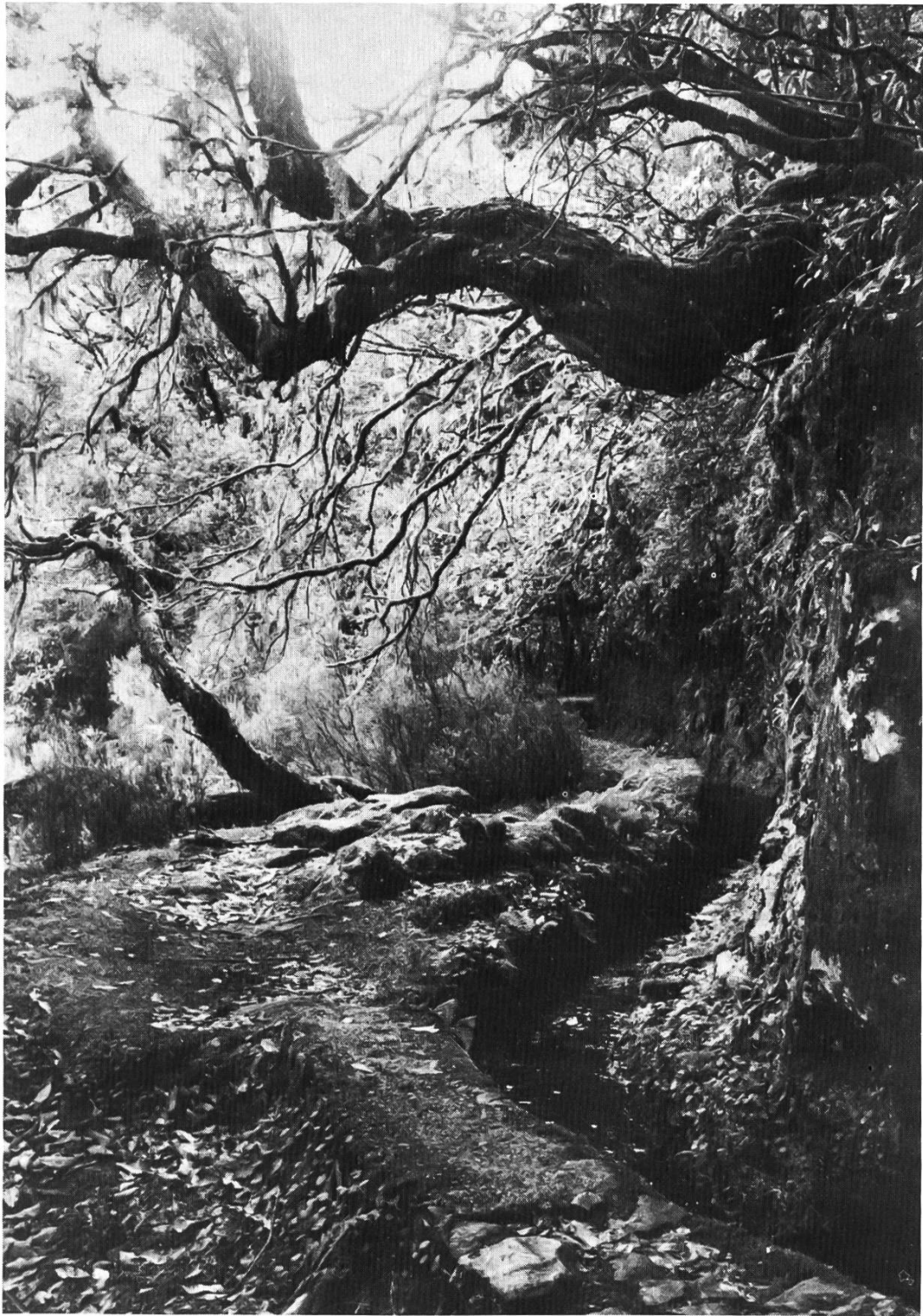
Abb. 1: Die alte Levada do Furado unter einem Dach von Erica arborea nahe Ribeiro Frio.