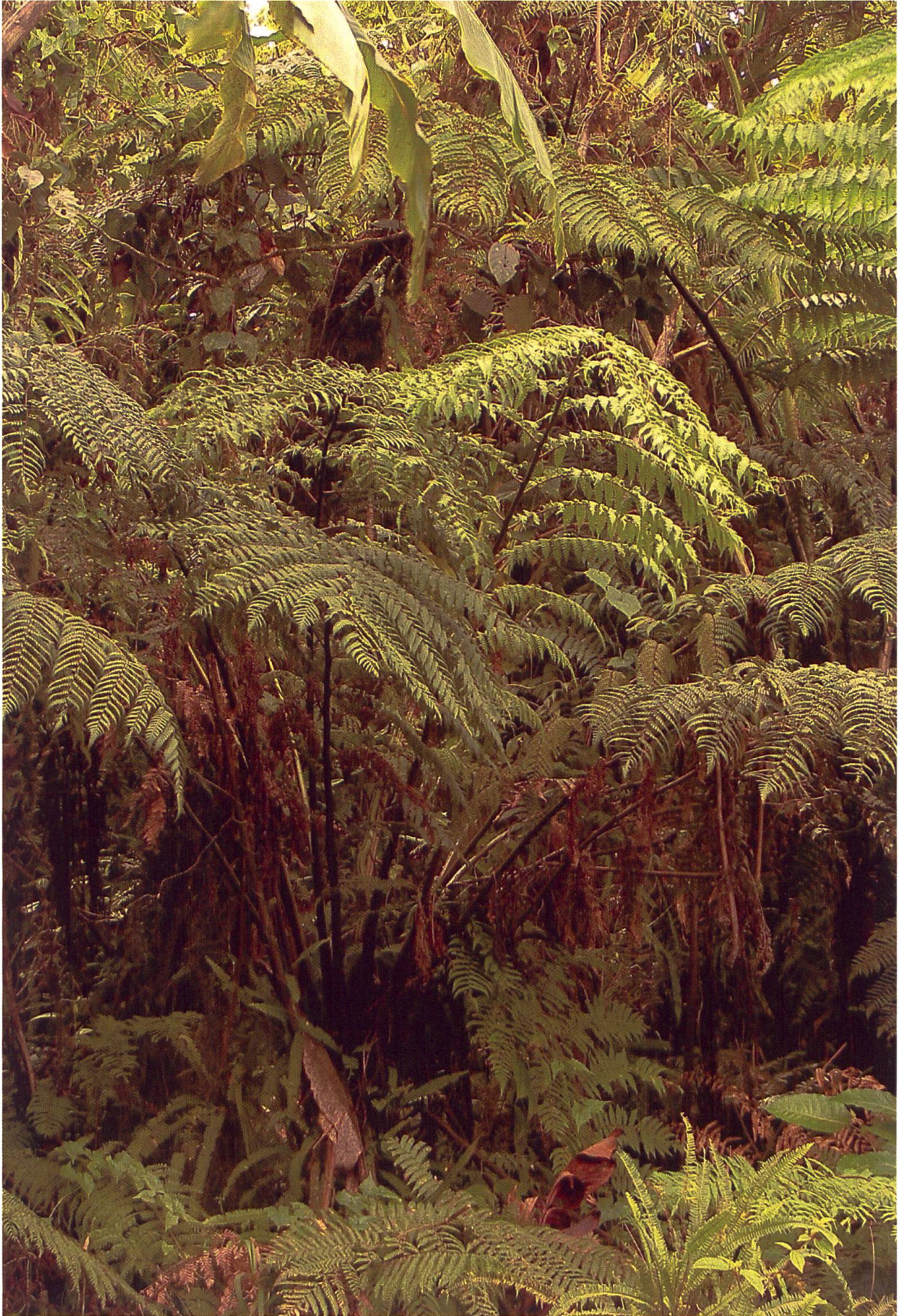
Im dichten Regenwald auf Fiji findet man Dicksonia brackenridgei zusammen mit vielen anderen Farnen.