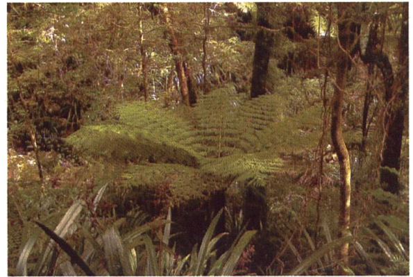
Dicksonia antarctica im Unterholz eines temperaten Regenwaldes im Osten Australiens (Lamington NP).

Die Extraktion dieser Pflanzen aus dem natürlichen Habitat in Südaustralien wird streng kontrolliert, um die Populationen zu schützen.