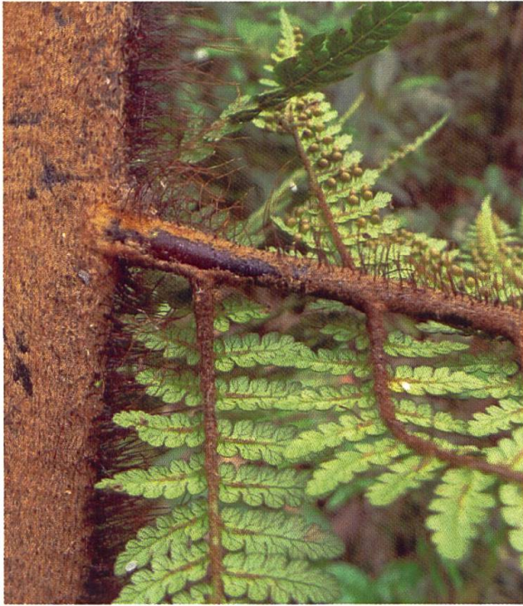
Dicksonia archboldii aus Neuguinea weist unter den abstehenden rotbraunen Borsten ein dichtes helles Schuppenkleid auf.

Ein vollkommen unerwartetes Ergebnis unserer genetischen Untersuchungen war, dass die drei Arten, die nur auf der Insel St. Helena im Südatlantik ( D. arborescens L'HER.) und den Juan Fernandez Inseln im Südpazifik vor Chile ( D. berteroaana (COLLA) HOOK, D. externa C. CHR. & SKOTTSB.) vorkommen, am nächsten mit letzterer Artengruppe verwandt sind und nicht mit den geografisch näheren Südamerikanern.