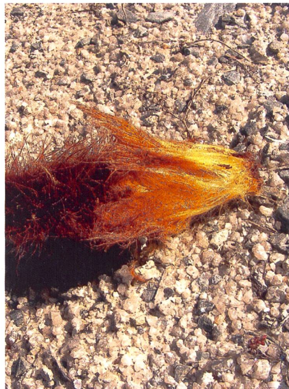
Am Blattstiel von Dicksonia herbertii lassen sich gut die für die Familie Dicksoniaceae typischen Borsten sehen.

In der Farngattung Tmesipteris (Psilotaceae) sind mehrere Arten gar fast vollständig auf Dicksonia spezialisiert. Auch Orchideen- und Bromeliengärtner wissen die Dicksonia-Stämme zur Herstellung von Pflanztöpfen zu schätzen. Gebietsweise hat dies zu einer Ausbeutung der Bestände geführt, so dass der internationale Handel mit allen Arten reguliert wird. Eine ältere Nutzung, die heute nicht mehr stattfindet, gab es in Tasmanien: Die dortigen Aborigenees nutzten das stärkehaltige Mark von D. antarctica als Nahrungsmittel.