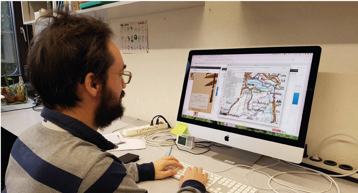
Abb. 3: Anschliessend werden am Computer (geht auch von zuhause aus) die Etikettendaten eingegeben und falls nötig die Belege basierend auf den Ortsangaben georeferenziert. (mk)

gegeben ist, die Herbarien in eine neue Zukunft zu führen. Material und Informationen von Belegen zu Vorkommen in der Vergangenheit sind sowohl für grundlegende Forschungsprojekte zur Pflanzenvielfalt und Pflanzennutzung, als auch für angewandte Fragestellungen zu Natur- und Artenschutz sehr bedeutend.