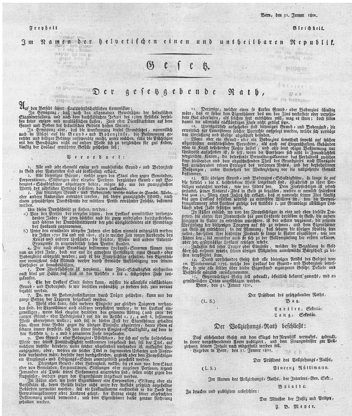
Bild 8 Gesetz der Helv. Republik von 1801 zum Loskauf der Grund- und Bodenzinse (Zürcher Unterländer Museumsverein, Oberweningen)

Nachdem der erste Versuch einer Ablösung der Feudallasten mit der Verfassung von 1798 gescheitert war, wurde ein neuer Anlauf genommen. Basierend auf dem Gesetz vom 31. Januar 1801 der Helvetischen Republik, lautete der Art. 21 der Mediationsverfassung des Kantons Zürich vom 20. und 22. Dezember 1803: «Die Verfassung sichert die Befugnis, Zehnten und Bodenzinse loszukaufen. Das Gesetz wird die Art und Weise dieses Loskaufes nach dem wahren Wert bestimmen.»