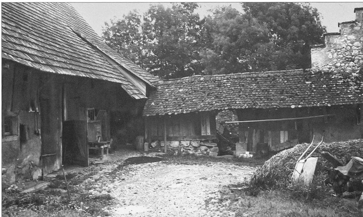
Bild 6a: Blick in den Mühlehof auf Verbindungsgang und Scheune, 1964