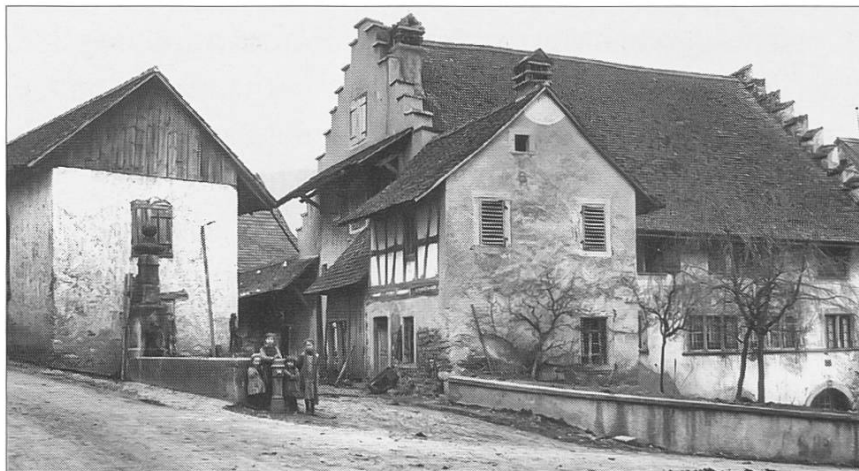
Bild 5: Aufnahme von Südwesten 1928. Der Brunnen steht noch an der Strasse vor der Einfahrt zum Mühlehof.