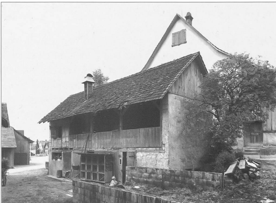
Bild 22: Nebenhaus vor Umbau, als Schweine- und Hühnerstall sowie Abort genutzt, Aufnahme 1964

Dieses Oekonomiegebäude dürfte kaum älter als 150 Jahre sein. Vor 1968 wurde im Erdgeschoss eine Schweinemästerei betrieben, ferner befand sich hier auch der einzige Abort für die ganze Mühle (siehe Bild 22). Heute ist der mittlere Teil offen gehalten zum Einstellen von Autos.