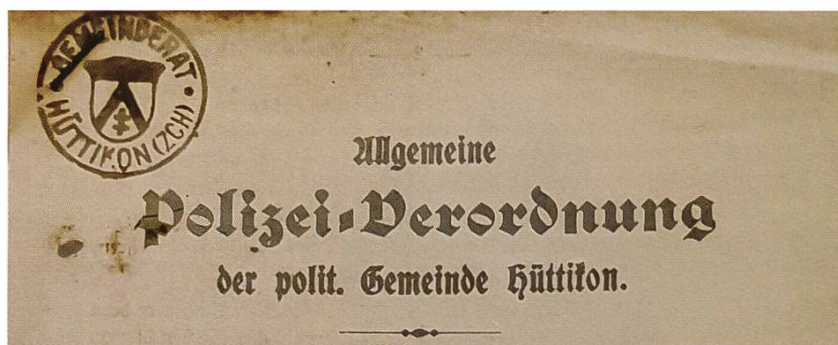
Abbildung 46: Titelbild der Hüttiker Polizei-Verordnung vom 28.09.1919

bestraft werden. Neben der Störung der öffentlichen Ruhe, lärmverursachenden Arbeiten während des Sonntags-Gottesdienstes und dem vorsätzlichen Belästigen des « Publikums » verbietet die Verordnung Folgendes: