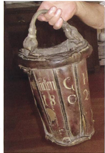
Abbildung 44: Feuereimer aus dem 19. Jahrhundert von Hans Schmid, Hüttikon

Zur Brandbekämpfung sind schon im Mittelalter allerlei Geräte entwickelt worden, wie die bekannten Handspritzen beispielsweise. Überdies haben erste Feuerlöschverordnungen festgelegt, dass abends ab einer bestimmten Zeit alle Feuer ausgemacht werden und jeder Haushalt einen Eimer Wasser für Notfälle bereithalten muss. Zudem haben die professionellen Feuerrufer die Pflicht, die Bevölkerung bei einem Brandausbruch zu warnen. Ab 1853 beschliesst Hüttikon, keine Feuerrufer mehr zu beschäftigen, da dies die Aufgabe und Pflicht jedes Bürgers sein soll.