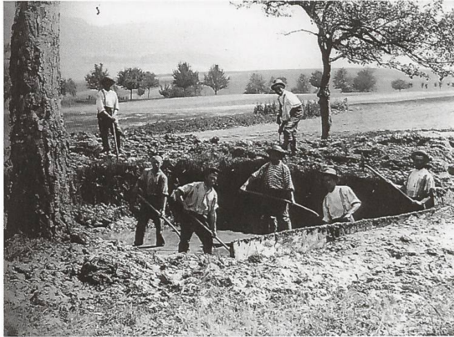
Abbildung 45: Grabenarbeiten für den Feuerwehrweiher unterhalb der Chriesbaumstrasse, undatiert

Seit 1947 werden Wasserverbrauchsrechnungen erstellt, und im Jahre 1949 wird der Vertrag mit dem Grundwasserpumpwerk Furttal genehmigt. Im Zuge dieses Projektes werden auf dem Gemeindegebiet in den 1950er-Jahren bis zu 70 Hydranten errichtet, wodurch die Feuerwehr wesentlich verstärkt werden kann.