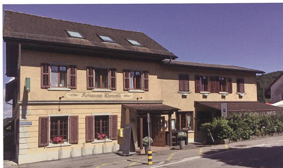
3 Im Alpenrösli Würenlos umgingen viele Furttaler illegalerweise den höheren Salzpreis im Kanton Zürich