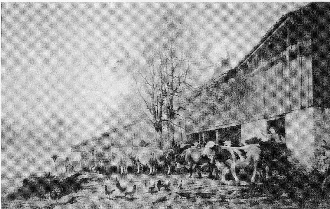
Peinture d'Edouard Jeanmaire: "La Joux-Perret". Musée des Beaux-Arts, La Chaux-de-Fonds

Il a aussi décoré en guirlandes: "Heureux dans ma peinture... Heureux dans mes amours... A La Joux-Perret , je passe mes plus heureux jours..."; entre deux portes, il illustre le Cantique des Cantiques biblique. Dans la belle chambre, il a aussi orné de magnifiques peintures le poêle de catelles.» 11