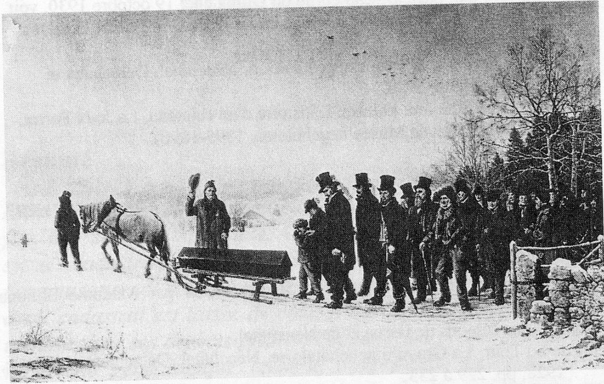
Peinture d'Edouard Jeanmaire: L'enterrement à La Joux-Perret. Musée des Beaux-Arts du Locle.