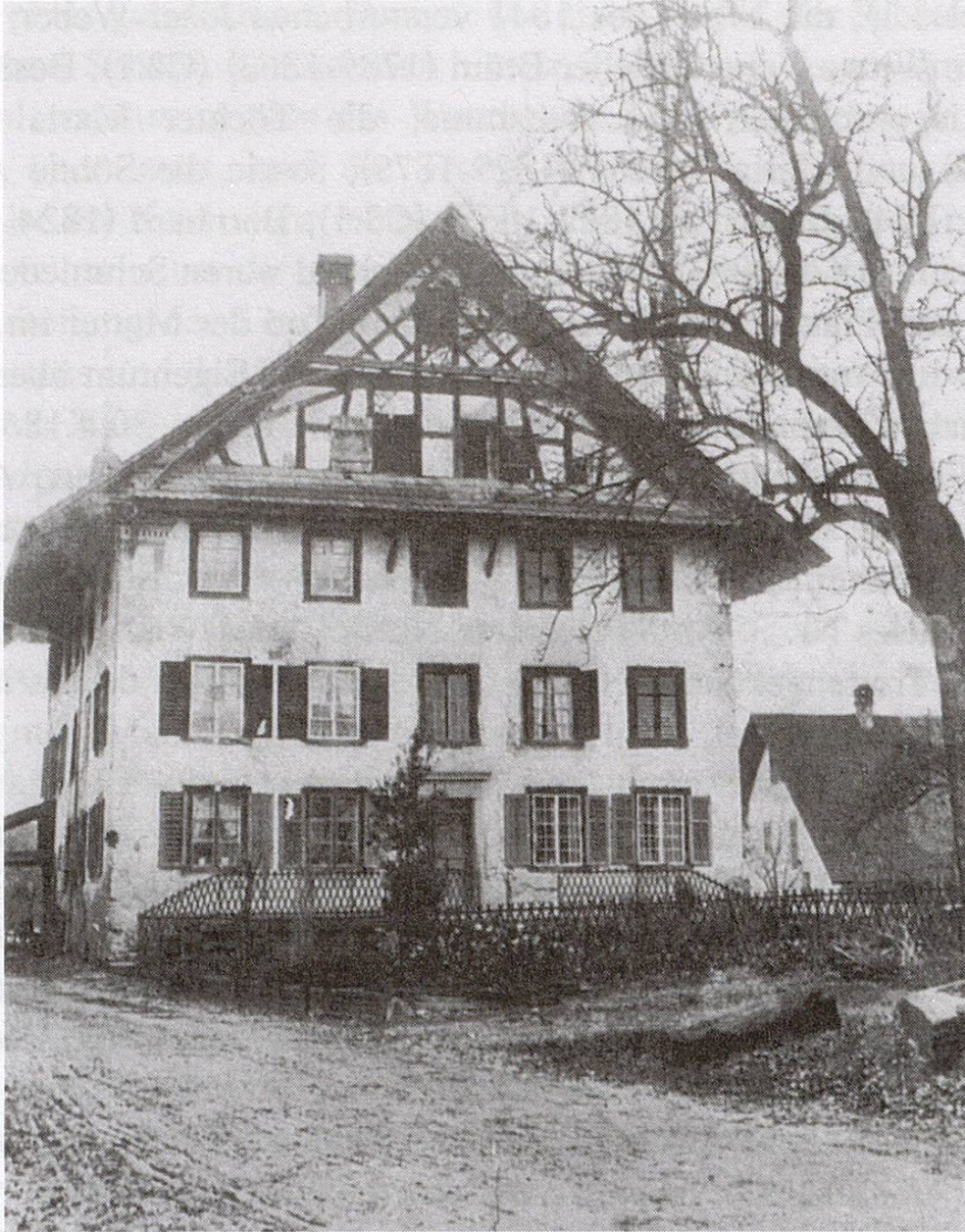
Abb. 3: Schmiedegebäude von Osten vor der Renovation von 1920, mit Fachwerkgiebel und Klebedach. An den Seiten waren Wandmalereien in Sgraffito-Technik sichtbar. Im westlichen Teil befindet sich die Schmiedewerkstatt, im östlichen (Hochparterre) die Wohnräume des Teils A. Im ersten Stock liegen gegen Osten die Wohnräume des Teils B, gegen Westen diejenigen des Teils C. Die Zimmer im zweiten Stock sind auf die einzelnen Parteien aufgeteilt. Ebenfalls aufgeteilt sind die Estrich- und Kellerräume.

wurde unter dem 28.6.1864 im Fertigungsprotokoll festgehalten (GA Sp FP 1864).