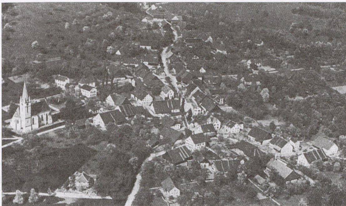
Abb. 1: Oberer Dorfteil von Spreitenbach 1923 (Zimmermann 1930, 47). Die Schmiede ist das markante Haus in der Mitte des Bildes im untern Drittel, links davon die Scheune.

Bauern kauften mit dem Gewinn aus den Landverkäufen Höfe in andern Kantonen. Wollte der Schmied überleben, musste er sich anpassen. Der Weg zu einer Installationsfirma mit neuen Werkstätten war offen. Nachdem 1995 die Schmiedewerkstatt durch Umbauten in einen Wohnraum umgewandelt wurde, ist von der alten Schmiede nichts mehr übrig. Dies ist ein Grund, deren Geschichte und die der Besitzer nachzuzeichnen.