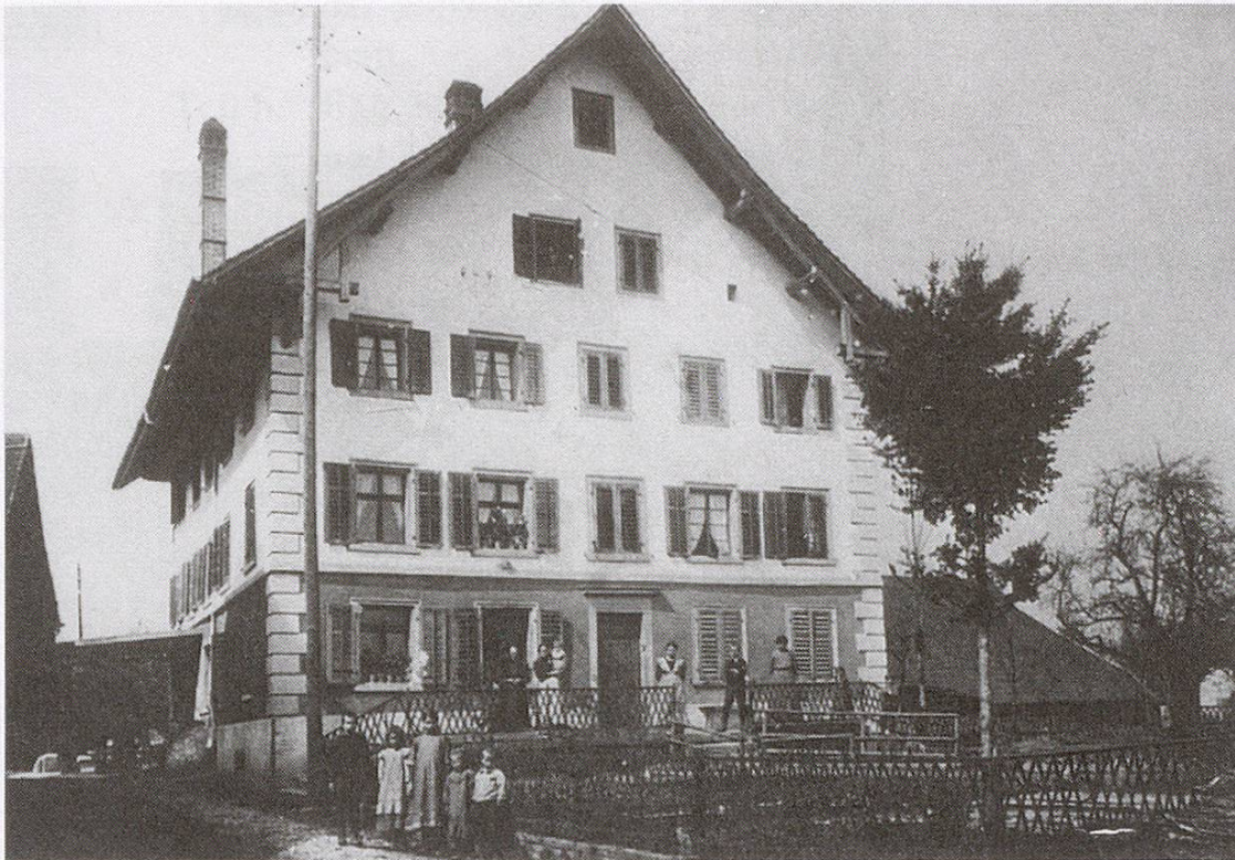
Abb. 4: Schmiedengebäude nach dem Umbau von 1920. Der eingezäunte Garten vor dem Haus, durchschnitten von einem gemeinsamen Weg (ca. 250 m 2), war in sechs Parzellen aufgeteilt, wovon jede Partei zwei, nicht nebeneinander liegende besass.