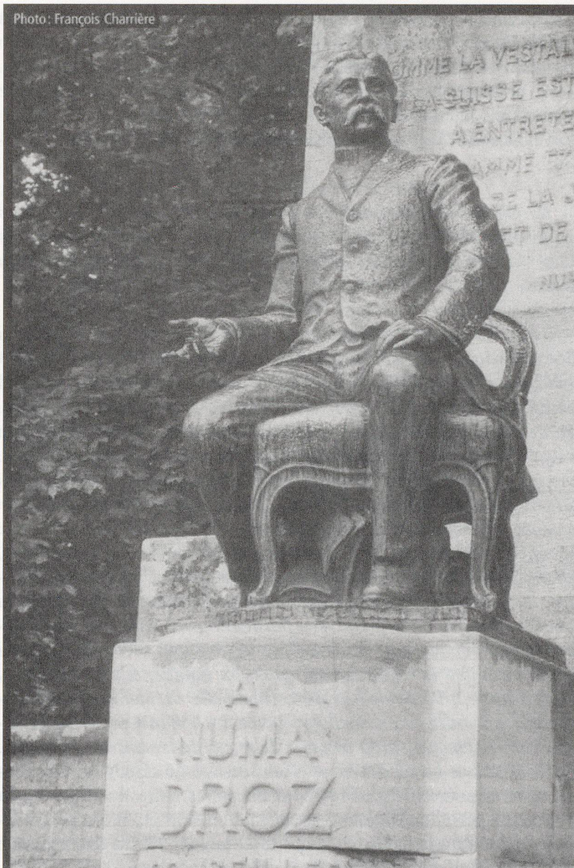
Fig. 1: Monument Numa Droz, Conseiller Fédéral, à la Chaux-de-Fonds, Courrier du Val-de-Travers hebdomadaire, année 2004