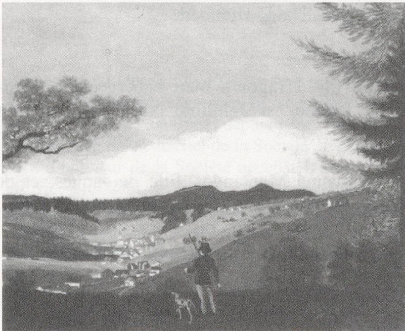
Fig. 2: Le Locle vers 1770

Jeanne-Marguerite mourra le 23 janvier 1741 au Locle. Elle avait épousé, le 8 décembre 1688 Claude Sandoz fils de Pierre communier du Locle, maistre-bourgeois de Valangin, nommé en 1695 justicier en l'honorable corps de justice du Locle, également gérant du Fonds de famille Sandoz créé en 1658.