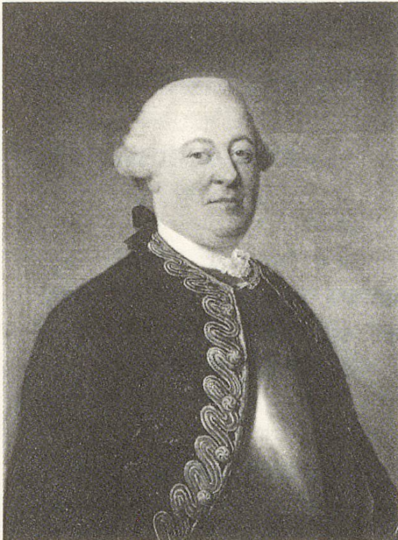
Fig. 2 Le général Claude-François de Sandoz