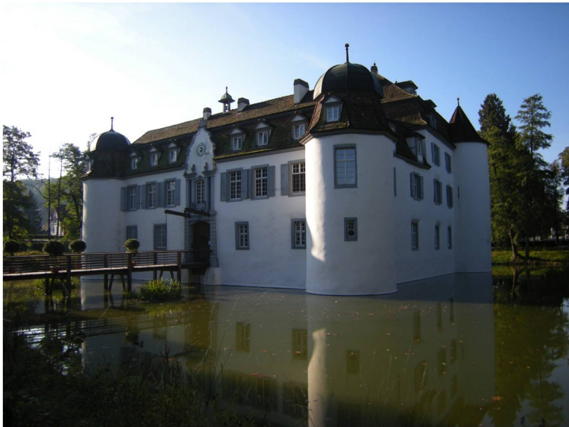
Abb. 7. Schloss Bottmingen, Bottmingen BL, schützt sich im flachen Gelände durch einen umlaufenden Wassergraben. Wenn der Graben breit und das Wasser ruhig ist, wird eine solche Anlage auch als „Weiherburg“ bezeichnet. Die ehemalige Burg aus dem 13. Jahrhundert wurde um 1720 in barockem Stil zum Schloss umgebaut.

wurde durch Steinbauten aus Mörtelmauerwerk abgelöst. In Rätien und im Tessin, vielleicht auch in der Westschweiz, hielt sich die Tradition des Steinbaues seit der Antike.