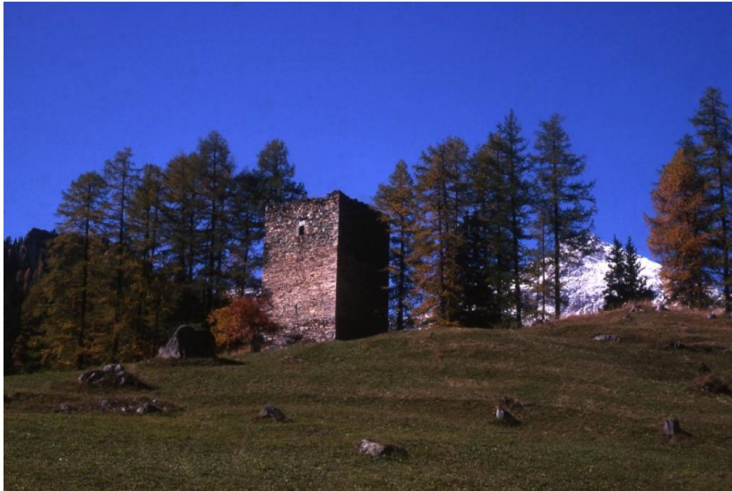
Abb. 2. Der Turm der Burgruine Spliatsch (Sur GR) erhebt sich in einer Schlaufe der Julier-Passstrasse und deutet so auf eine Funktion der Burg hin: Zoll- und Geleitrecht an einem Verkehrsweg.

Burgkapellen als Indiz für sakrale Funktion einer Burg gab es nur auf grösseren Anlagen; teils als selbstständige Baukörper, teils integriert in die Wohnbauten. Vereinzelt erhoben sich Pfarrkirchen im Wehrbezirk grösserer Burgen. Eine Sonderrolle spielten die als Fluchtplätze für die Bevölkerung konzipierten Wehrkirchen des Spätmittelalters sowie die Niederlassungen der Ritterorden, in denen Burg- und Klosterfunktionen vereinigt waren.