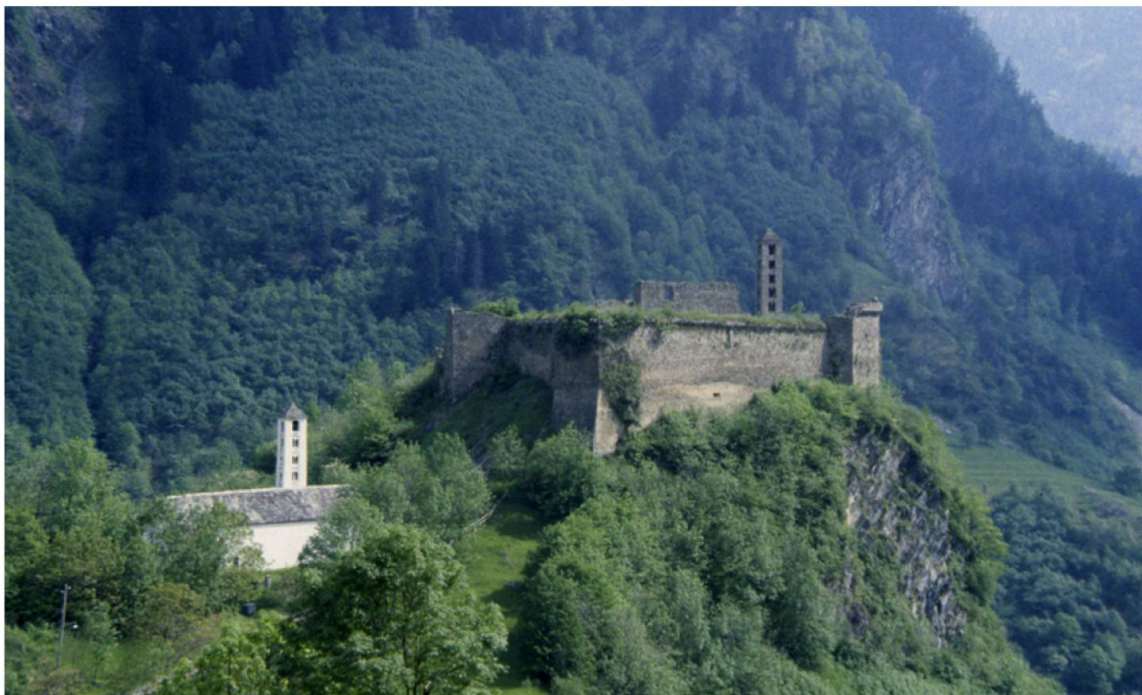
Abb. 3. Castello Mesocco GR. Auf einem mächtigen Felsriegel im Tal erhebt sich die Burg Mesocco, erbaut im 10. Jahrhundert und erweitert bis ins 14. Jahrhundert. In dieser Burg steht eine Kirche aus dem 11. Jahrhundert, die damit eine weitere Funktion einer Burg andeutet: das Kirchenkastell.

Burgkapellen als Indiz für sakrale Funktion einer Burg gab es nur auf grösseren Anlagen; teils als selbstständige Baukörper, teils integriert in die Wohnbauten. Vereinzelt erhoben sich Pfarrkirchen im Wehrbezirk grösserer Burgen. Eine Sonderrolle spielten die als Fluchtplätze für die Bevölkerung konzipierten Wehrkirchen des Spätmittelalters sowie die Niederlassungen der Ritterorden, in denen Burg- und Klosterfunktionen vereinigt waren.