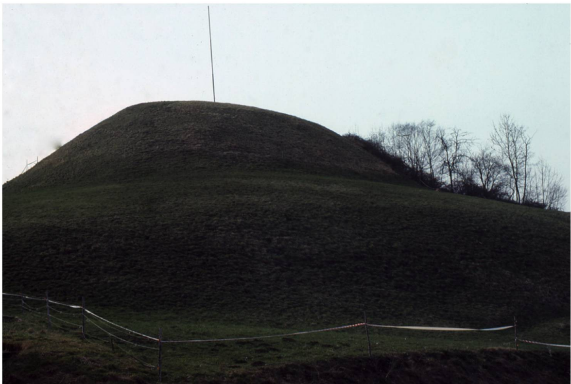
Abb. 8. Zunzger Büchel BL. Am Rande einer Talterrasse erhebt sich dieser Hügel. Im Kern verbirgt sich darin ein aufgeschütteter Hügel (Motte), auf dem einst im 10. Jahrhundert eine Burg aus Holz stand.

don). Die Verwendung grosser Findlinge (Megalithmauerwerk) findet sich vor allem im Machtbereich der Grafen von Kyburg. Das für die Stauferzeit charakteristische Buckelquader-Mauerwerk kommt vorwiegend im Molassegebiet des Schweizer Mittellandes vor (z.B. Kasteln-Alberswil, Kyburg). Backstein ist im Umfeld des Klosters St. Urban (z.B. Burgdorf) und verschiedenenorts in der Westschweiz (z.B. Vufflens) anzutreffen. Im 13. und 14. Jahrhundert erfolgten Um- und Ausbauten vornehmlich wegen der Verbesserung der Wohnqualität und des Verteidigungswerts (Flankierungs- und Tortürme, Zwinger, erhöhte Zinnen). Frühe Grossburgen wurden infolge von Funktionsbeschränkungen im Grundriss reduziert (Habsburg) oder infolge Verschiebung des Herrschaftszentrums aufgegeben (Montsalvens).