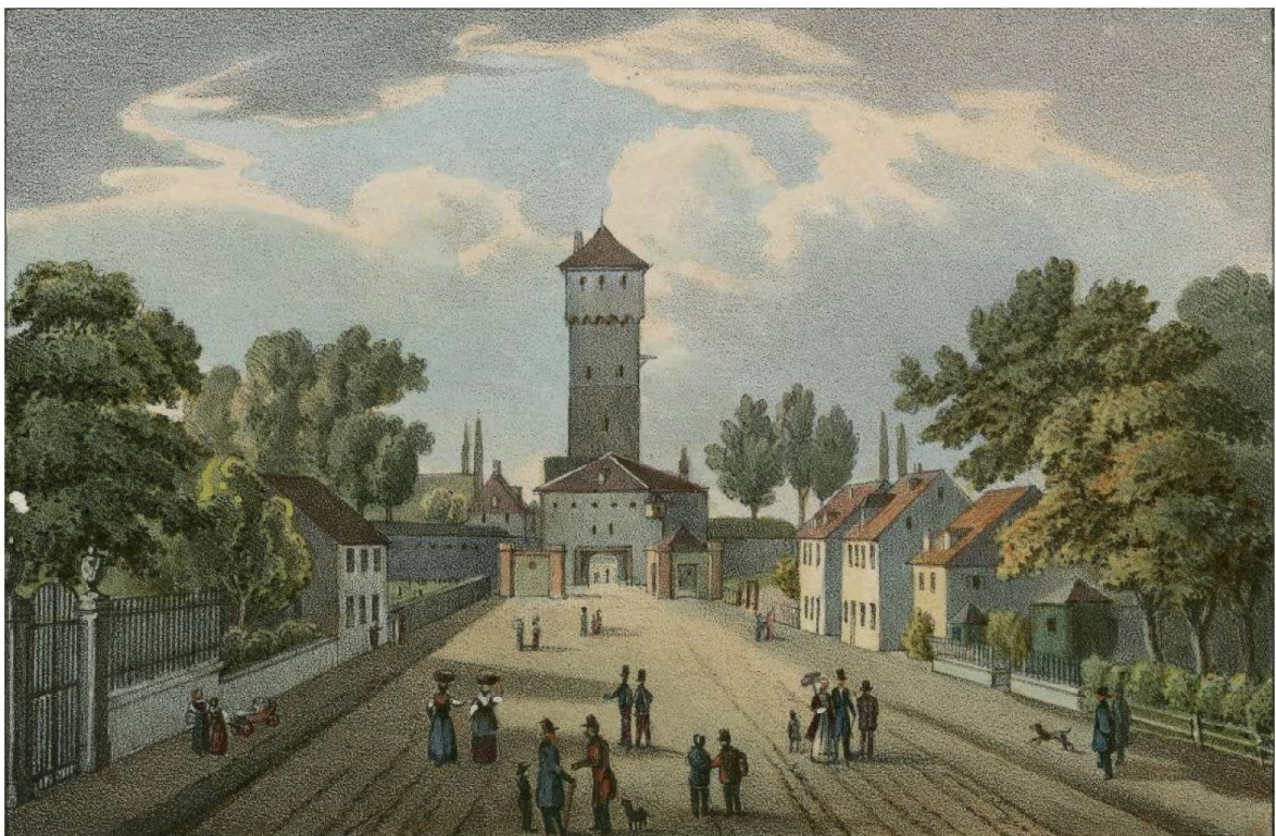
Abb. 2: Das St. Johannstor erhielt die Hausnummer 1. Von hier aus nummerierten die Truppen Napoleons die ganze Stadt Basel von 1 bis 1759 durch. Links gerade vor dem Tor erkennt man die Friedhofsmauer und die Grabsteine des Spitalgottesackers. Basel um 1840/50 (Lithografie, Kreide;).