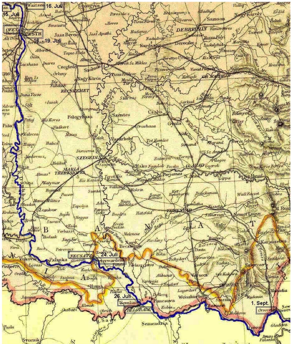
Abb. 4. Reise von Mitte Juli bis 1. September

Morgen 5 zu laufen. Semlin gegenüber auf der Mittagsseite des Wassers ist die grosse und wohlbefestigte Stadt Belgrad in der Turkey in Serbien. Hier war schon oft der Schauplatz der blutigsten Kriege. Wir hielten uns einige Zeit in Semlin auf, und nachdem wir uns bis Orsova verproviantiert, fahren wir weiters. Auf der rechten Seite der Donau hatten wir nun die Turkey und auf der Linken