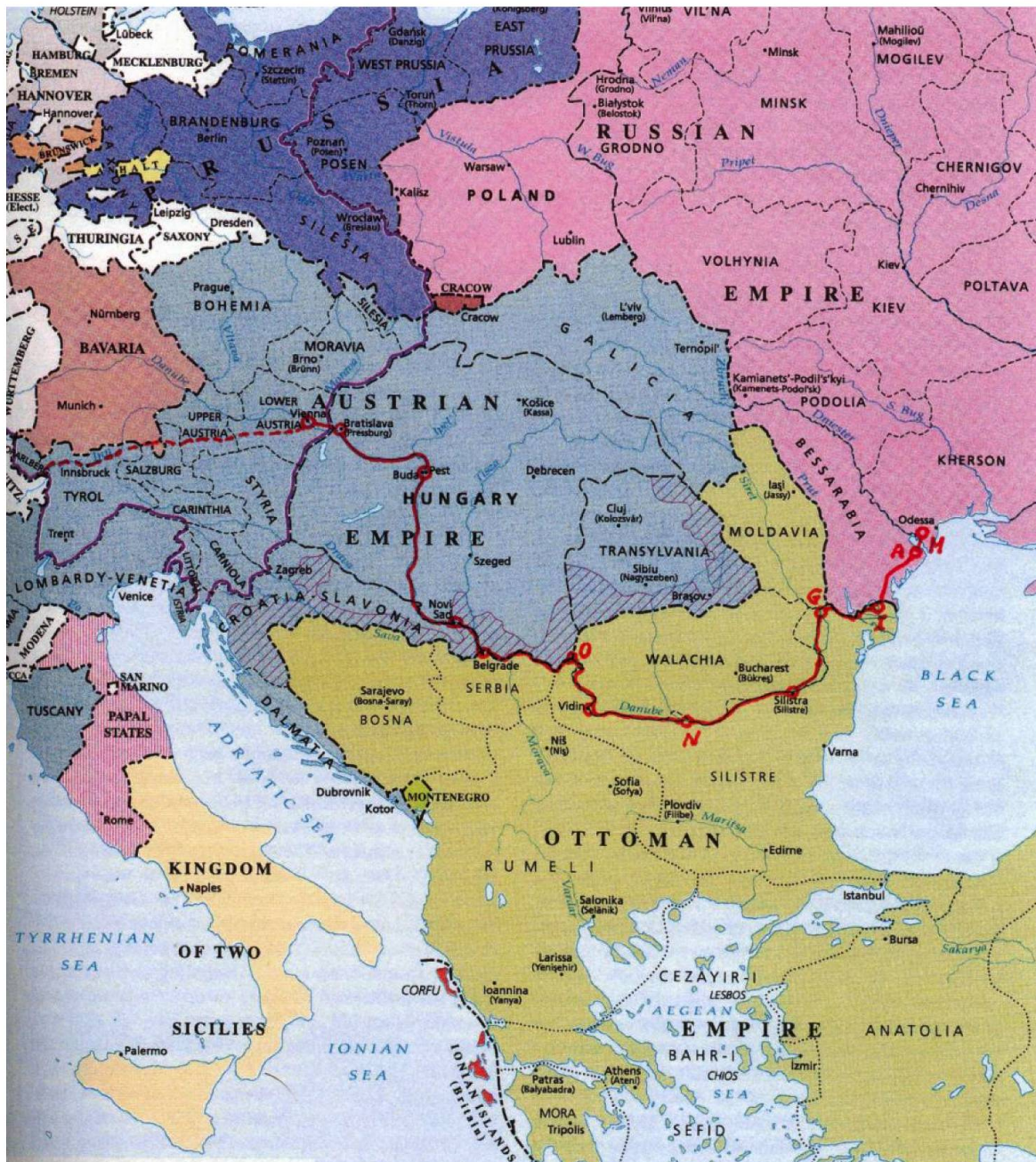
Abb. 3. Reiseroute: Wien – Bratislava – Budapest – Novi Sad – Belgrad – Orsova – Vidin – Nicopol – Silistra – Galatz – Ismael – Akerman – Marienthal

Stadt Neustadt; hier landeten wir, der General-Colonie-Pass wurde dort unterzeichnet und das Volk gezählt. Diese Gegend ist sehr reizend, hier hatte es auch viele Deutsche. Die Stadt ist schön, und gewerbsam, hier verproviantierten wir uns bis Semlin, alles war hier sehr wohlfeil. Semlin ist eine Grenzstadt und Festsung, wo der Fluss Sau in die Donau fällt, und der Donau-Fluss anfängt gegen