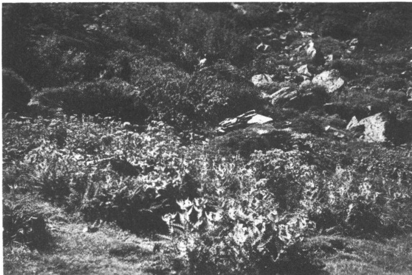
Abb. 1. Peucedano ostruthii - Cirsietum spinosissimi im oberen Bergell.

Im einförmigen Sattgrün der alpinen Lägerflora erblühen, weithin leuchtend, die hellgelben Distelköpfe des Cirsium spinosissimum . Sie kennzeichnen die Plätze, wo die Rinder lagern oder öfter beisammen stehen. Dem ammoniakgesättigten Boden entspiesst ein üppiges nitrophiles Staudenwerk aus Cirsium spinosissimum , Peucedanum ostruthium , Aconitum napellus , Adenostyles alliariae , Veratrum album , Arten die unter normalen Futterverhältnissen vom