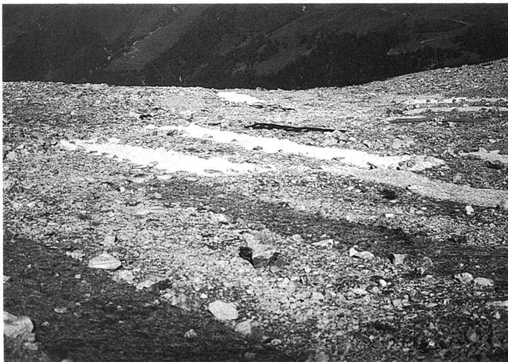
Fig. 2. Die Versuchsflächen am Jakobshorn.

Oben: Gesamtansicht. Skipistenplanie mit Versuchsflächen, zu beiden Seiten die natürlichen Vegetationen sowie am unteren Bildrand ein Teil der Geröllhalde.