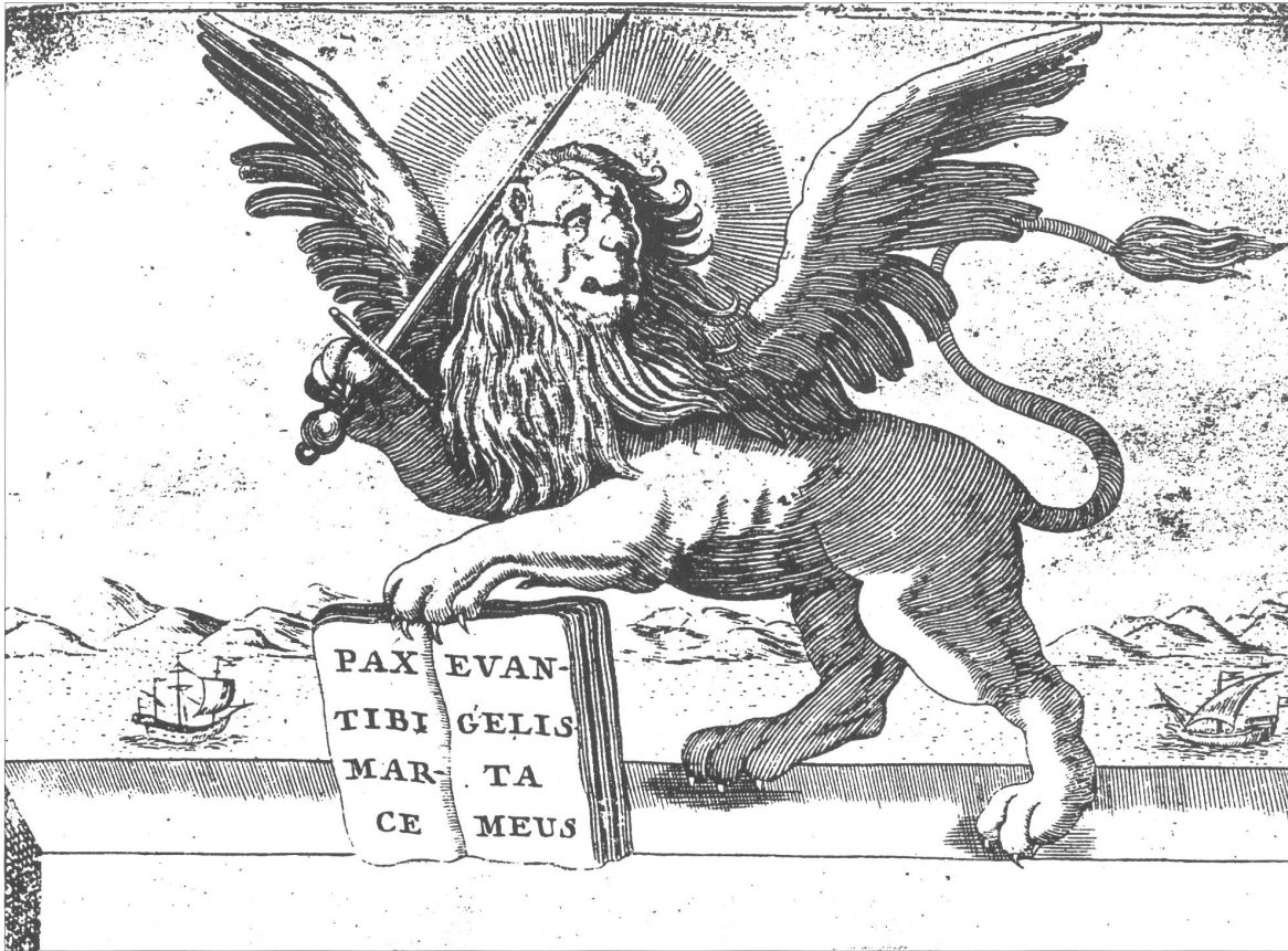
Abb. 3: Marco Boschini, »Der Markuslöwe vor der Insel Kreta«, Frontispiz (Detail) in: Boschini, Il Regno tutto di Candia , Venedig 1651.