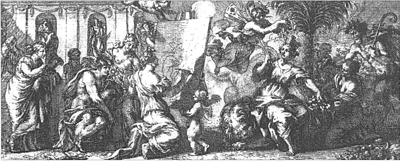
Abb. 14: »Pittura und die drei italienischen Malerschulen«, Frontispiz in: Scannelli 1657.