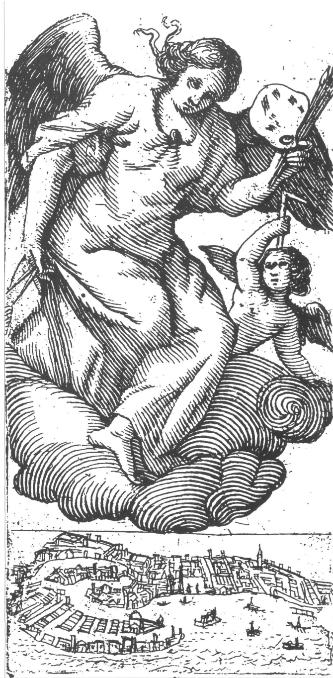
Abb. 10: Marco Boschini, »Pittura mit Cupido über Venedig«, Frontispiz in: Minere 1664.