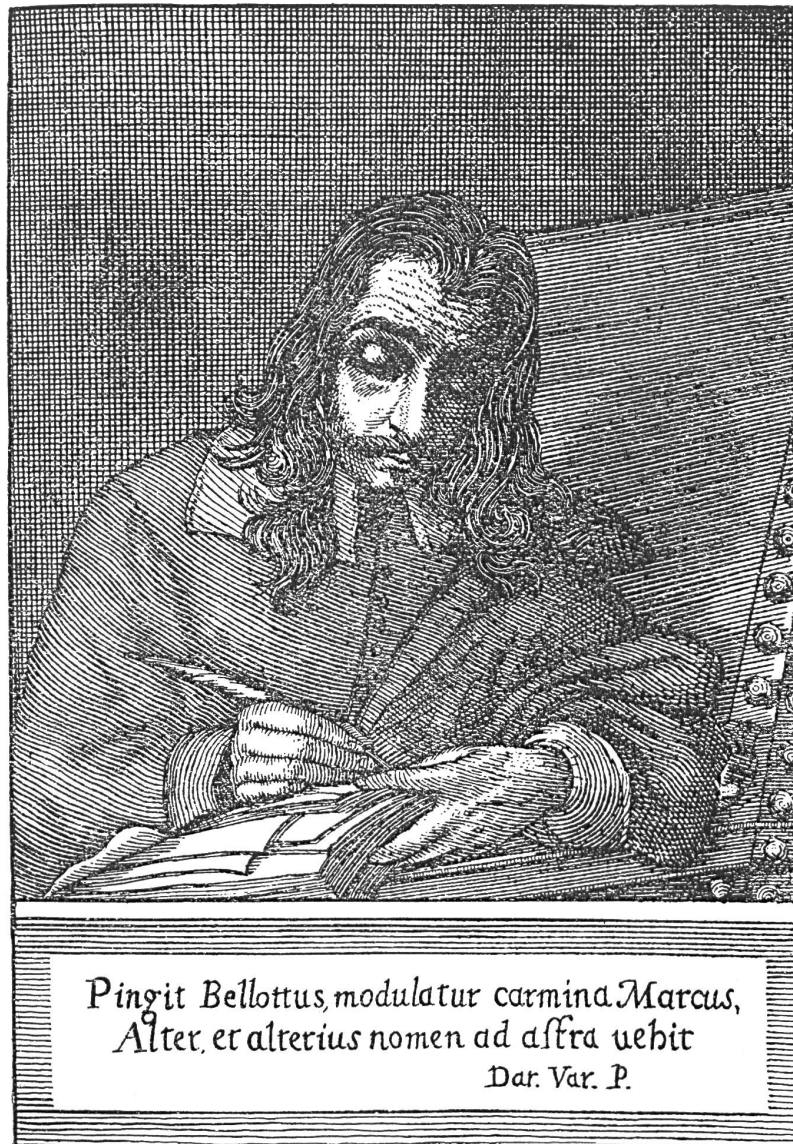
Abb. 8: Marco Boschini, »Selbstbildnis als Schreiber«, Radierung nach Pietro Bellotto, zweites Frontispiz in: Carta 1660.