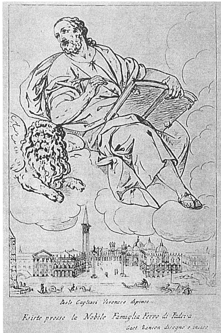
Abb. II: Gaetano Zancon, »San Marco«, 1802, Radierung nach einem früher Paolo Veronese zugeschriebenen Gemälde.