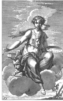
Abb. 18: »Pittura«, Frontispiz in: Della Pittura veneziana Trattato , Venedig 1797.

Abb. 17: »Venetia-Pittura«, Frontispiz in: Zanetti, Della Pittura veneziana e delle Opere Pubbliche de' veneziani Maestri , Venedig 1771.