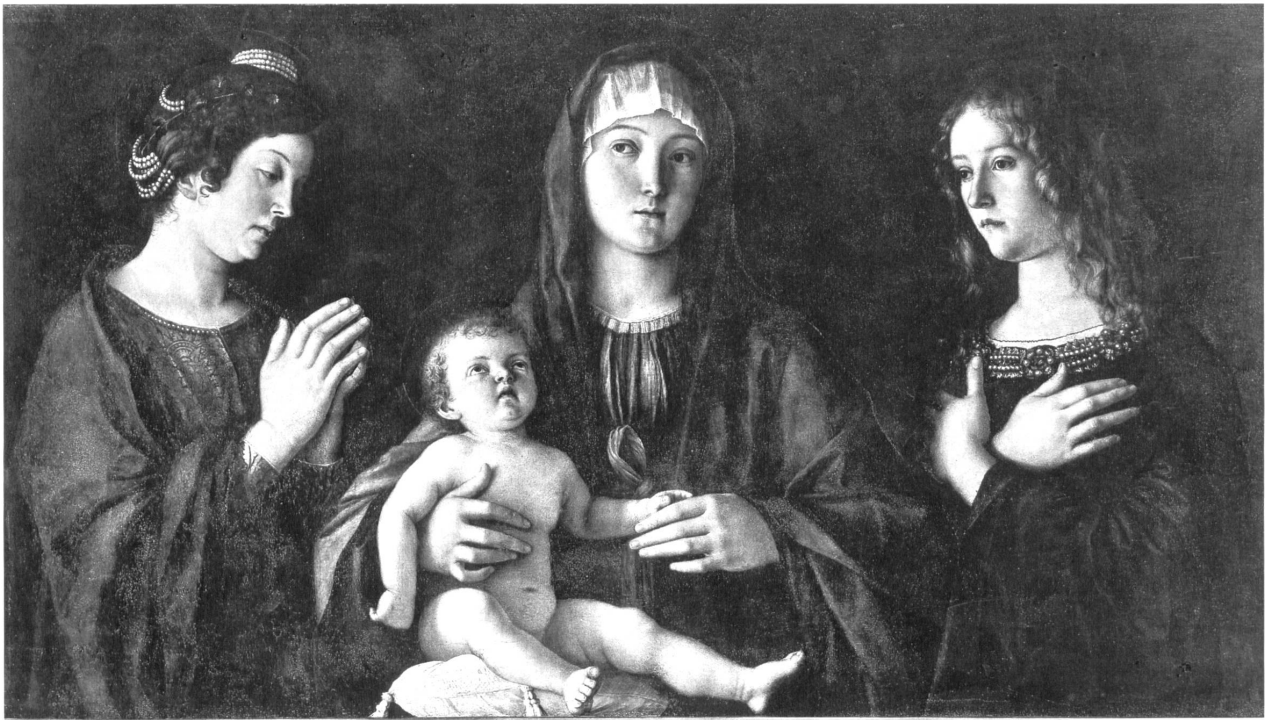
Abb. 4: Giovanni Bellini, „Madonna mit Kind zwischen zwei weiblichen Heiligen“, 1490–95, Öl auf Holz, 58 x 107 cm, Venedig, Galleria dell'Accademia.