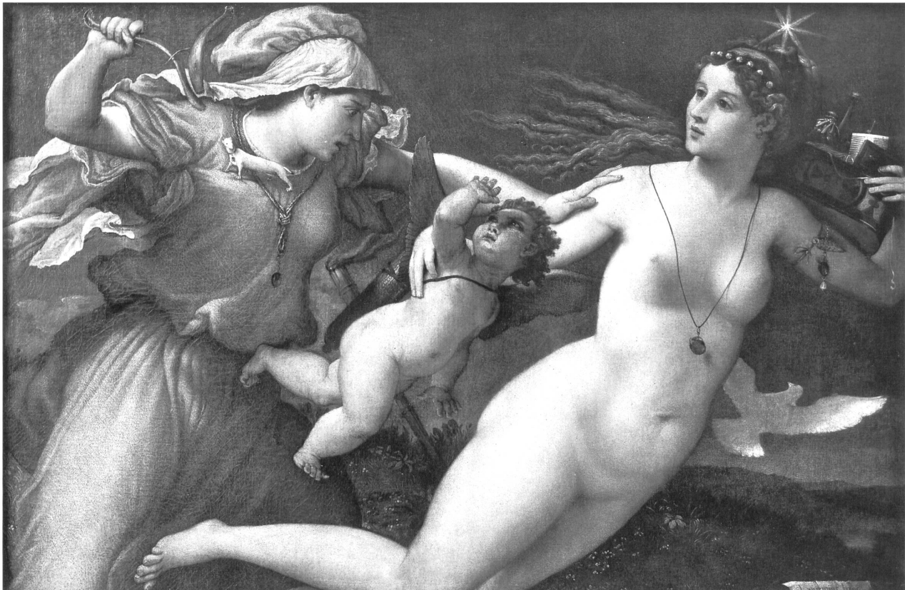
Abb. 14: Lorenzo Lotto, »Triumph der Keuschheit«, Öl auf Leinwand, um 1526, 73 x 114 cm, Rom, Palazzo Rospiglioso Pallavicini.

schlussreich ist allerdings, dass der heute kaum mehr geläufige Topos der »unglücklichen Braut« demnach im 16. Jahrhundert verbreitet war. 71