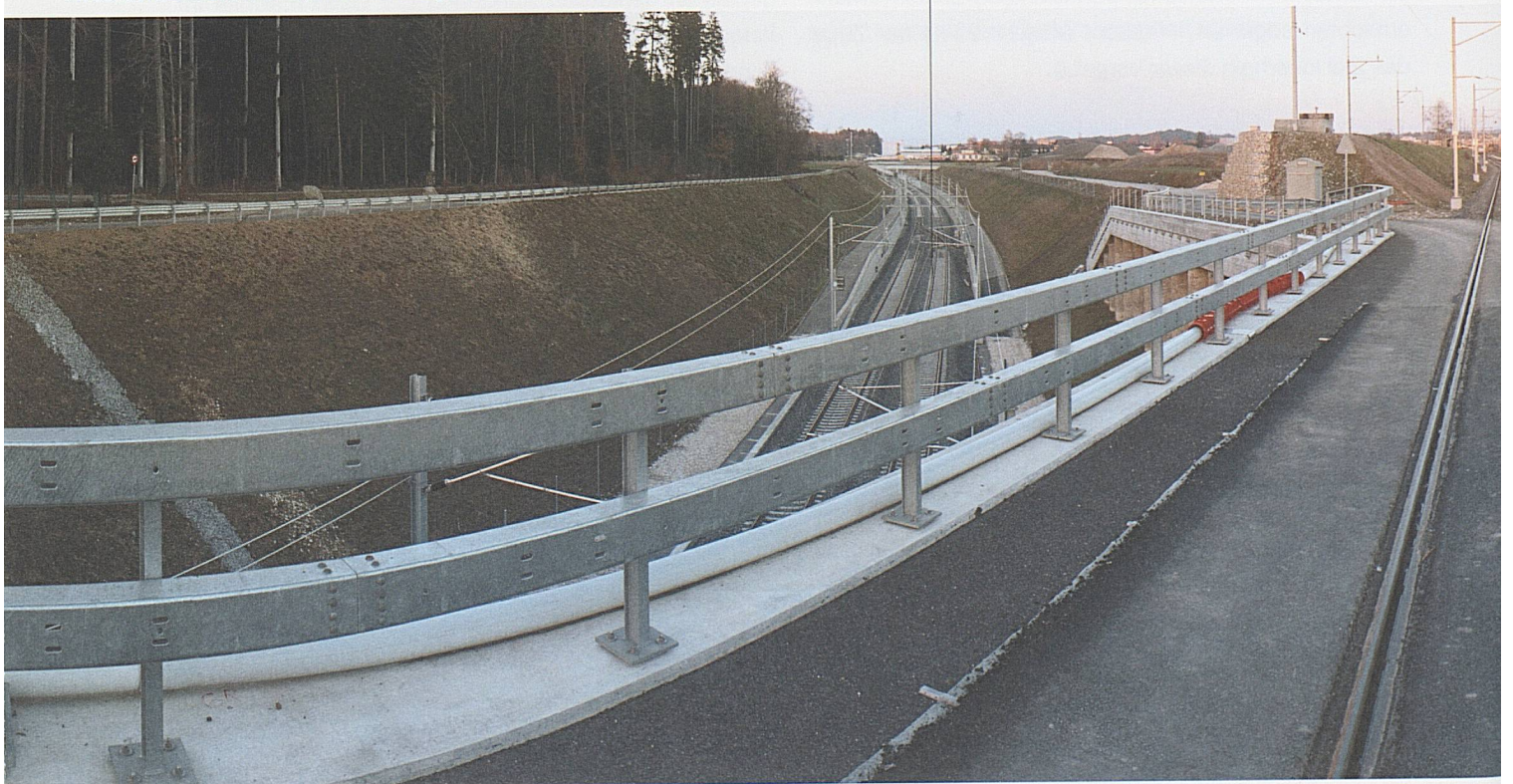
Neubaustrecke Bahn 2000, zwischen Langenthal und Herzogenbuchsee

Die längste Baustelle der Schweiz. Die Neubaustrecke Mattstetten-Rothrist ist das Kernstück der Bahn 2000: 45 Kilometer neue Bahnstrecke, 14 599 Meter Tunnel, 20 Brücken und 3 Wildquerungen. Keine Weiche, nur flotte Fahrt. Die Reisezeit Bern-Zürich beträgt noch 58 Minuten.