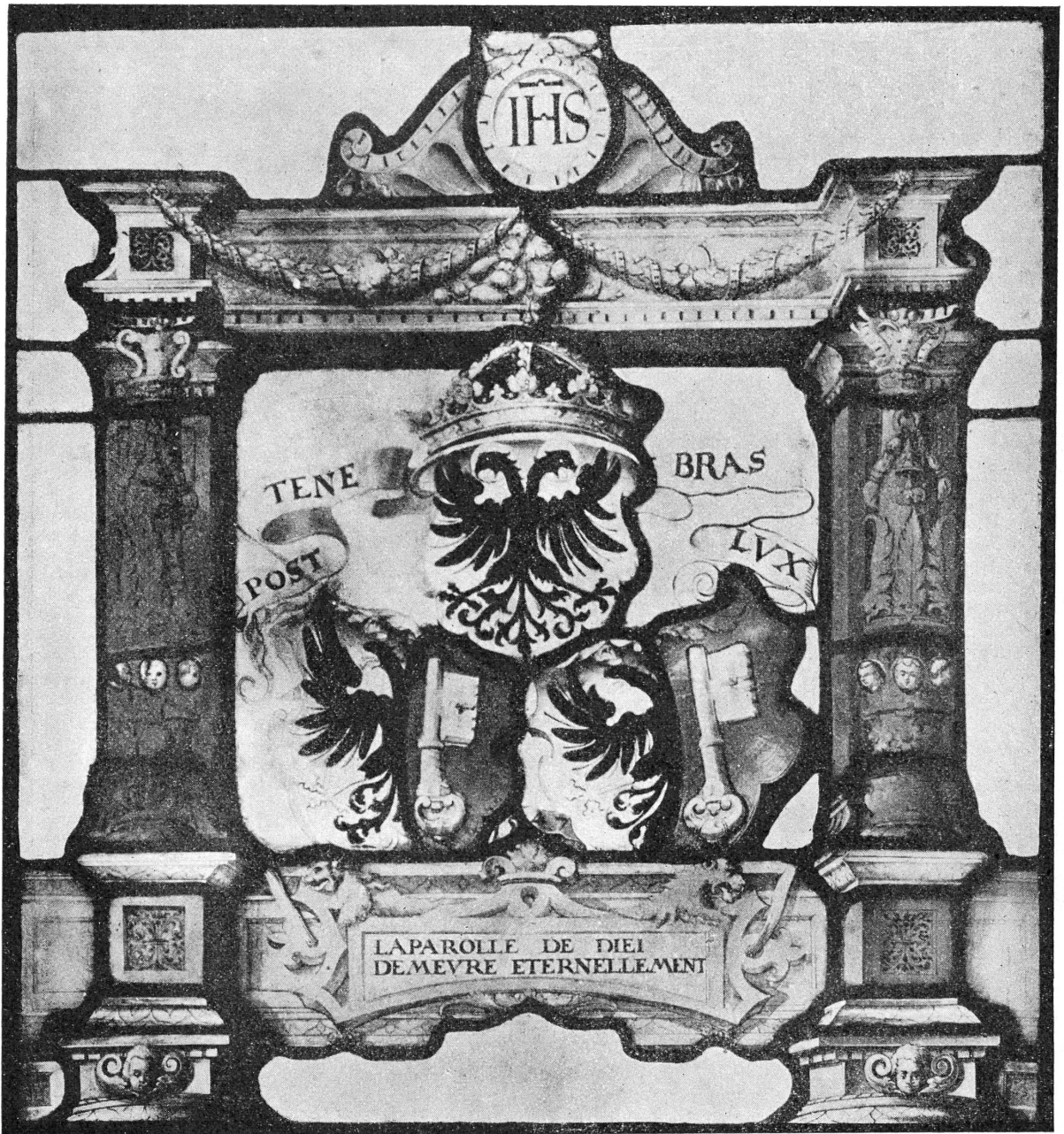
FIG. 2. — Vitrail aux armes de Genève, 1547.

à Paris en décembre 1922; il a été reproduit et décrit dans le catalogue de cette vente 1 , et tout récemment par M. le professeur P. Ganz 2 .