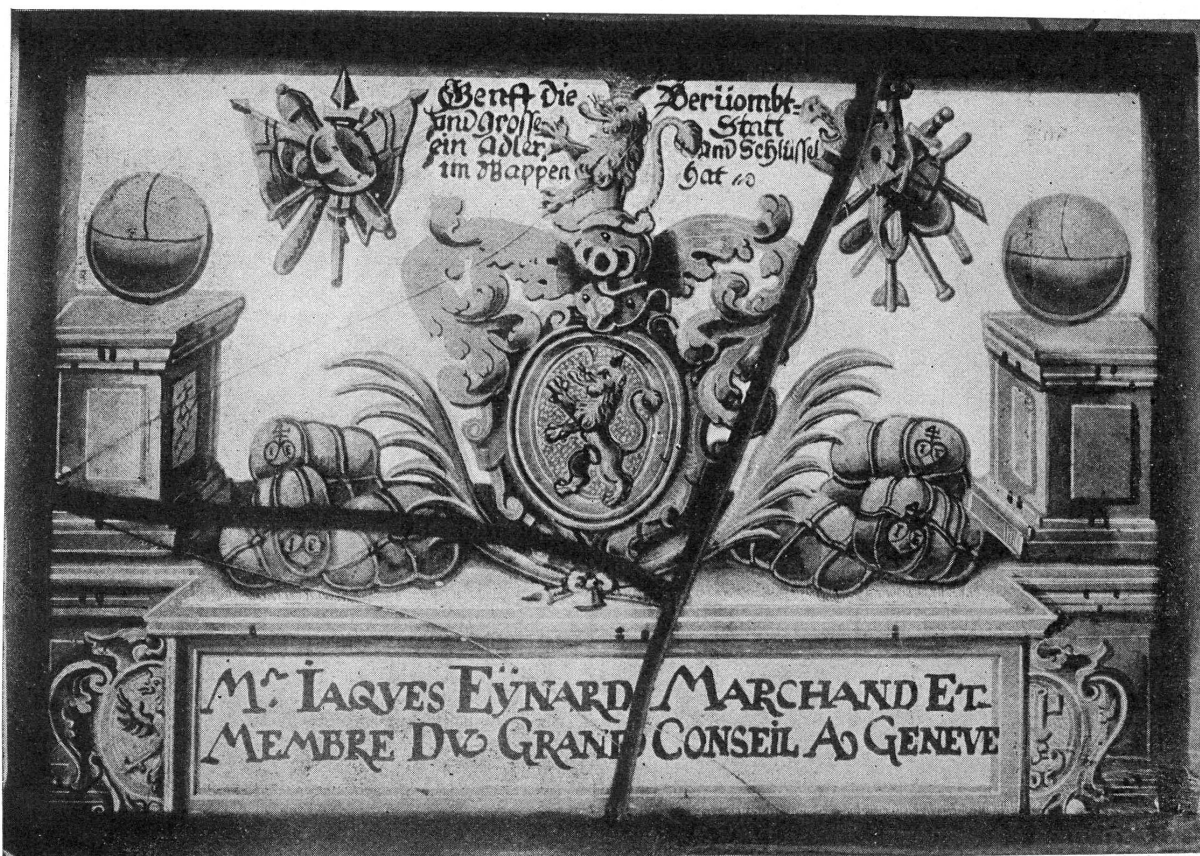
FIG. 3. — Vitrail aux armes de la famille Eynard.

2° Un fragment de vitrail, qui était un médaillon rond de 20 centimètres environ, de la seconde moitié du XVI e siècle; il faisait partie de la collection du syndic