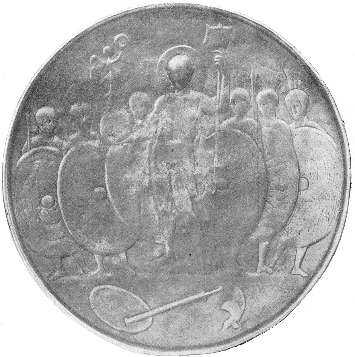
FIG. 2. — Le missorium de Valentinien.