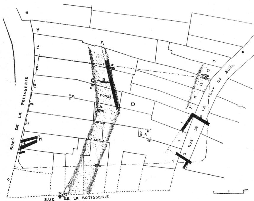
FIG. 1. — Plan des fouilles Péliisserie-Tour-de-Boël.

Epoque gauloise. — A l'autre extrémité du chantier, tout près de la Tour-de-Boël, à un mètre sous le sol des maisons Nos 13 et 15, dans du sablon, nous avons pu remarquer deux squelettes entiers étendus l'un à côté de l'autre et orientés est-ouest, la tête à l'ouest ( fig. 1. I ). L'un d'eux se trouvait sous le mur mitoyen très peu