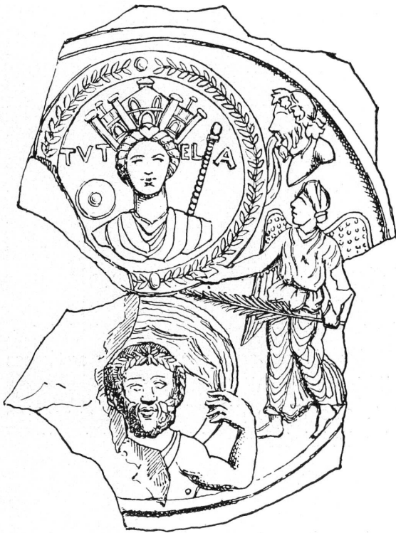
FIG. 2. — Médaillon de terre cuite de Vienne.

Tychè, d'un Genius, d'une Tutela, ait été fort répandue et fréquemment appliquée dans le monde gréco-romain. Ce n'est pas là d'ailleurs un fait exceptionnel dans les religions antiques. Derrière la façade anthropomorphique du paganisme classique, tel que nous le représentent surtout les artistes, les poètes, les mythographes, l'étude directe des cultes nous met en présence de faits bien différents. Des sources et des lacs ont été honorés directement, sans aucune mention de nymphes ni d'êtres divins quelconques, et les offrandes qu'on leur apportait étaient jetées dans les eaux elles-mêmes. Il en était de même de certains arbres, aux branches desquels les fidèles suspendaient leurs ex-voto. Le hêtre, sous le nom de Fagus , le chêne-rouvre sous le nom de Robur , même un bouquet de six arbres, sous le nom de Sexarbor deus ou de Sexarbores , étaient dans la Gaule romaine l'objet de cultes populaires 1 . C'est par le même procédé que les villes ont pu être tenues pour des êtres divins. Des savants