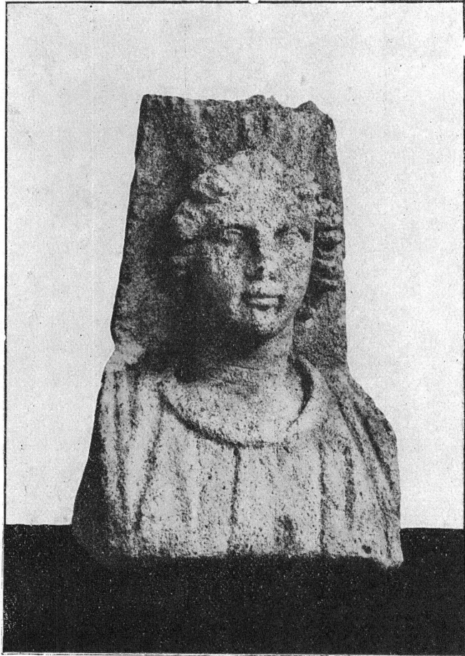
FIG. 3. — Alesia divinisée; haut-relief de pierre.

Sur un médaillon de terre cuite, originaire de Vienne, la Tutela de la colonie est coiffée d'une véritable forteresse, composée de murs et de tours rondes. Une inscription, qui occupe le champ du médaillon, à droite et à gauche du buste, ne laisse aucun doute sur la véritable identité du personnage 2 (fig. 2). Sans doute, l'expression Tutela ne répond pas exactement, comme nous l'avons vu plus haut, à la conception de la ville divinisée. Mais, comme nous savons, par une inscription découverte à Rome 3 , qu'un culte était rendu à la dea Vienna , nous pouvons admettre que cette déesse était représentée sous les mêmes traits.