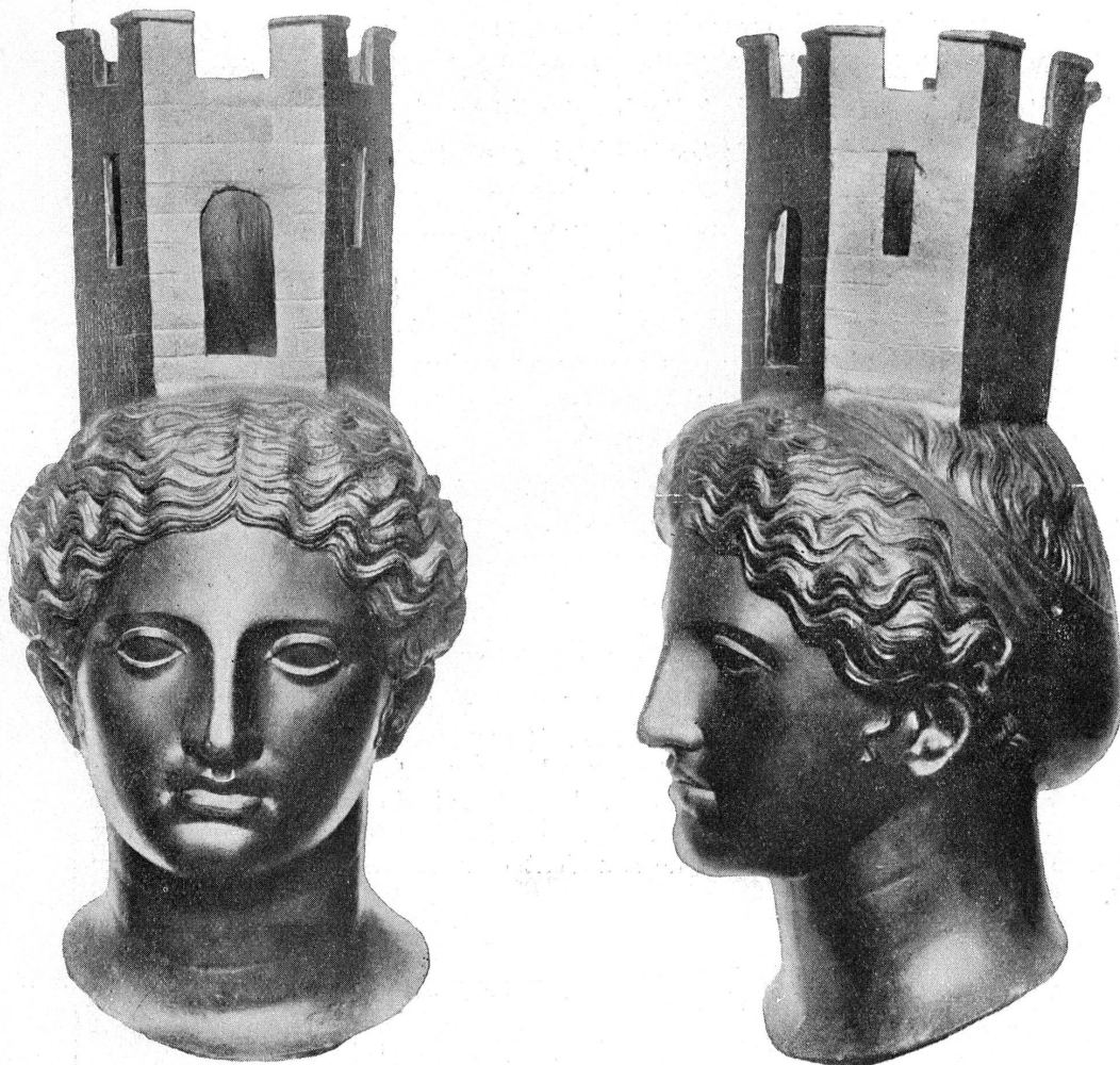
FIG. 5-6. — Lutetia divinisé; tête de bronze.

Et tel est aussi le caractère de la tête trouvée à Saverne ( fig. 4 ), autrefois Tres Tabernae , étudiée et publiée dans le bel ouvrage consacré par R. Forrer à l'archéo-