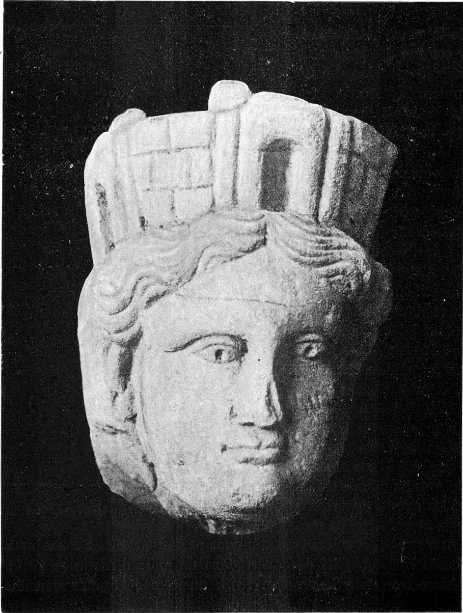
FIG. 4. — La ville de Tres Tabernae divinisée.

Le buste en haut-relief d'Alesia a été publié et étudié dans Pro Alesia (nouvelle série), t. II, p. 152 et suiv. ( fig. 3 ). Nous n'y insisterons pas longuement. Mais il est bien difficile de ne pas remarquer, comme nous l'avons fait alors, la physionomie en