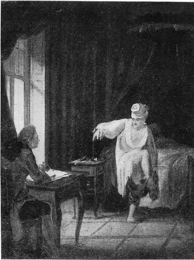
FIG. 2. — Jean Huber. Le lever de Voltaire.

Jean HUBER, le Lever de Voltaire (N° 1923-28). — Déposé en 1923 par la Fondation Gottfried Keller ( fig. 2 ).