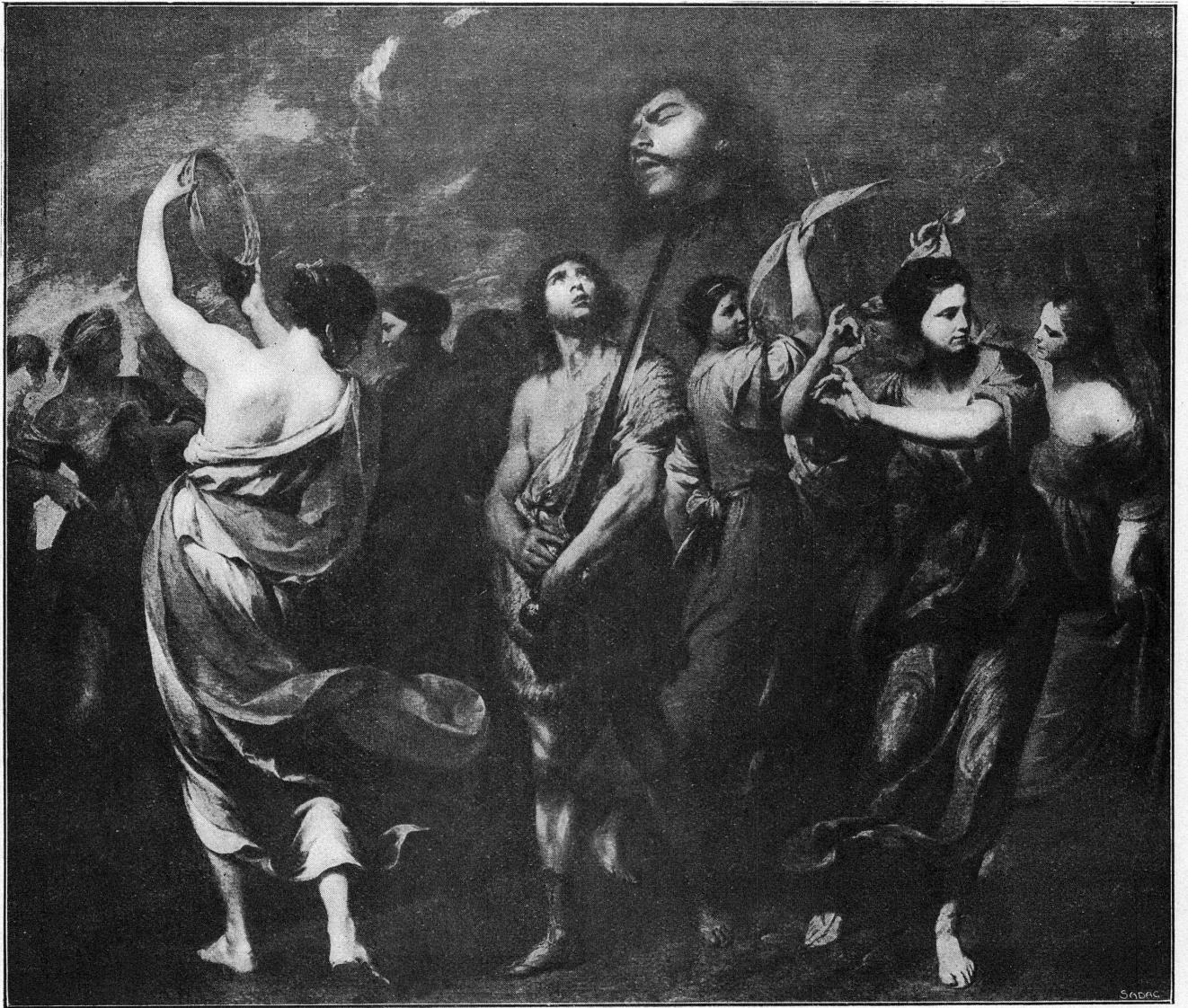
FIG. 3. — Andrea Vaccaro. Le Triomphe de David.

qu'ils ont appliquée avec tant de succès aux maîtres des siècles précédents. Ils réunissent les documents écrits, les documents photographiques; ils établissent des catalogues raisonnés. Sans ce travail préparatoire, il est impossible de se reconnaître dans la formidable production de cette époque, dans l'étude de laquelle quelques érudits