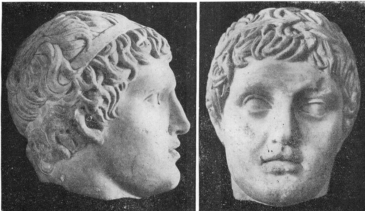
FIG. 28-9. — 9305. Tête masculine. IV e -III e s. av. J.-C.

Le motif central de ce tapis se compose des armoiries de la famille Le Fort et il a été brodé à la main par une douzaine de jeunes filles genevoises qui formaient