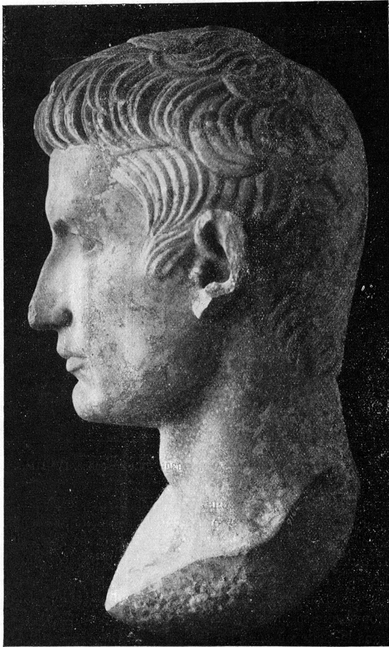
FIG. 27. — 9164. Tête d'Auguste.

à des conditions très favorables pour nous, d'un des plus beaux bouquets de fleurs