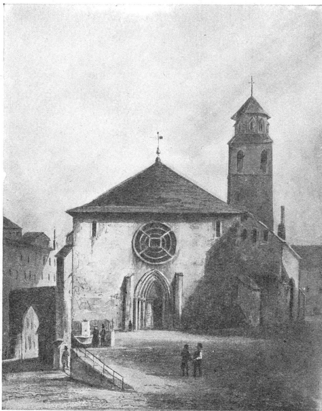
L'église La Madeleine, en 1837. (D'après une aquarelle d'Albert Hentsch.)